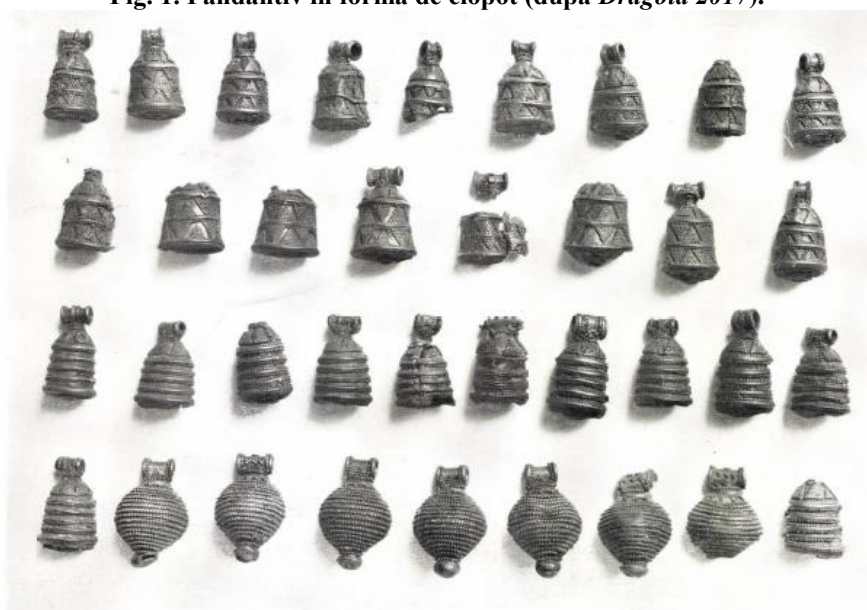
Fig. 2. Pandantive din argint, Drassburg/Darufalva (după Bóna 1964 ).