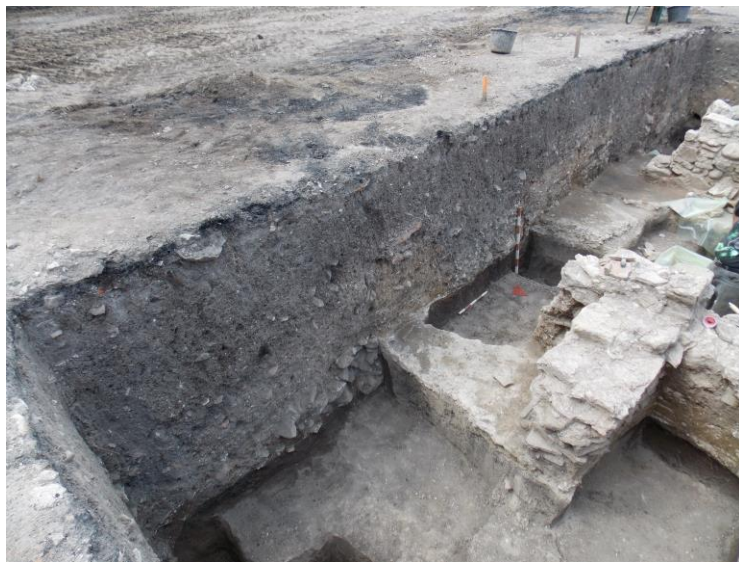
Fig. 3b. Imagine a profilului secțiunii S1, str. Mitropolit Alexandru Șterca-Șuluțiu, nr. 1;