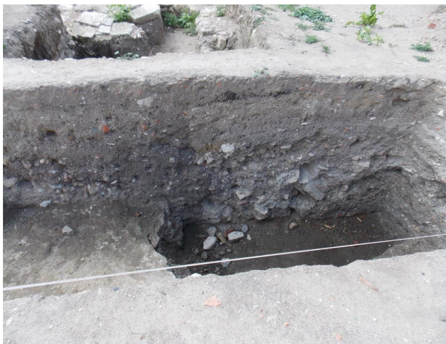
Fig. 3c. Imagine a profilului secțiunii S8, str. Mitropolit Alexandru Șterca-Șuluțiu, nr. 1.