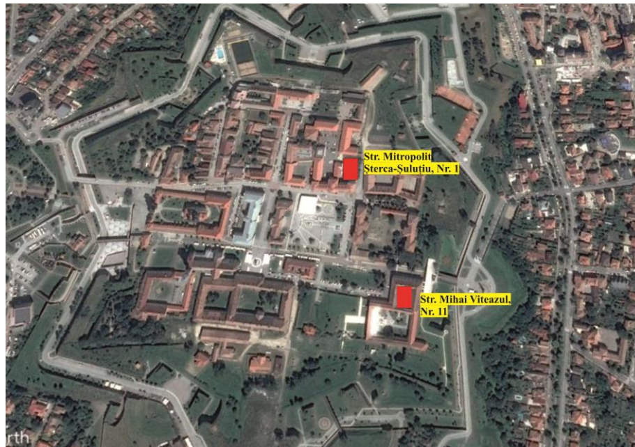
Fig. 1. Puncte cercetate pe str. Mihai Viteazul, nr. 11 și pe str. Mitropolit Alexandru Șterca-Șuluțiu, nr. 1.