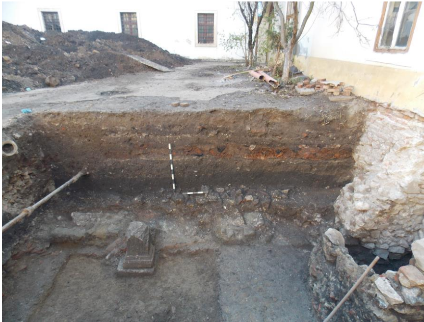
Fig. 3a. Imagine a profilului Casetei 7, str. Mihai Viteazul, nr. 11.