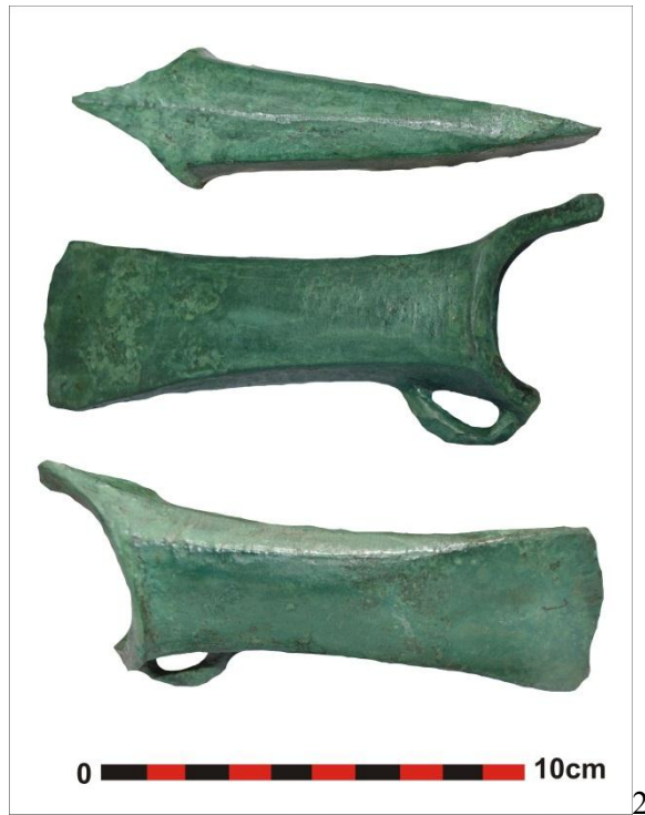
Pl. II. 1. Celtul de bronz de la Gâmbaș; 2. Imagine de ansamblu a celtului.