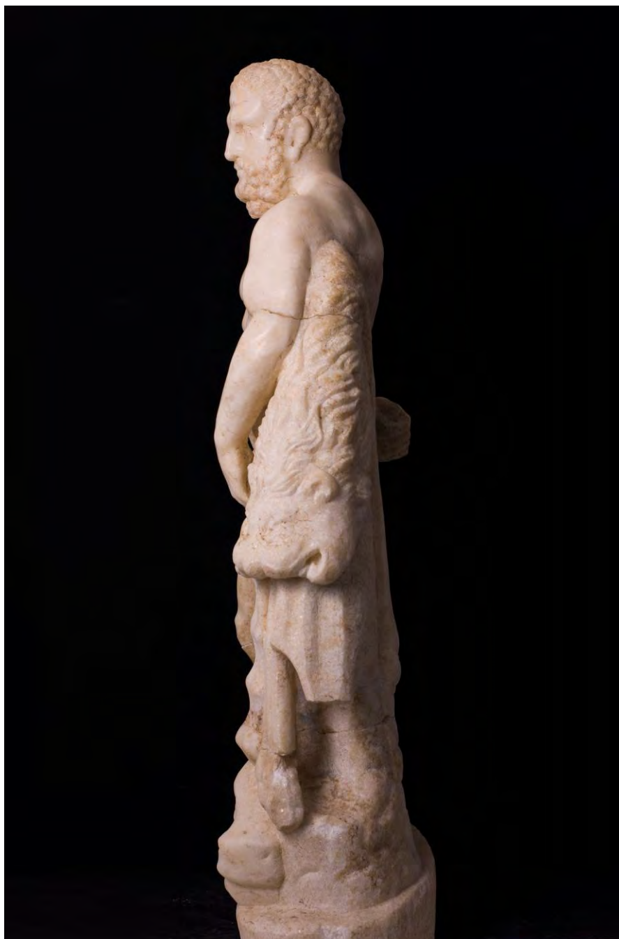
Fig. 9. Hercules Apulensis . Vedere dinspre stânga.