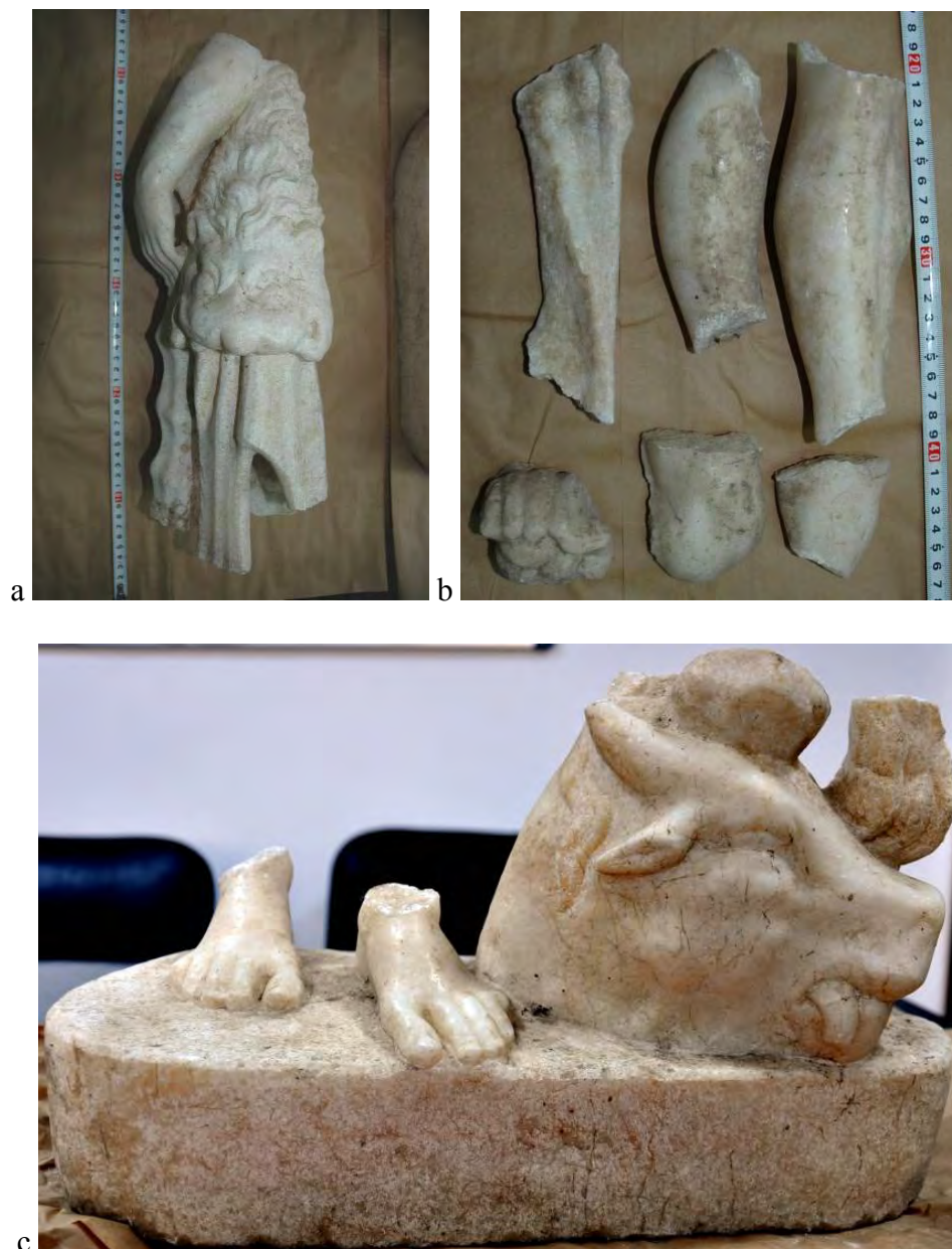
Fig. 6. Fragmentele de statuie recuperate: a. mâna stângă cu ghioaga și blana leului; b. mâna dreaptă și gamba dreaptă, c. postamentul.