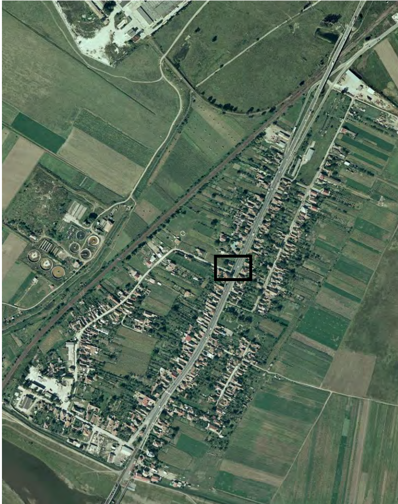
Fig. 3. Vedere aeriană asupra cartierului Partoș, cu precizarea arealului de descoperire a statuii lui Hercules.

Undeva la sfârșitul lunii martie a anului 2012 14 , pe strada Dacilor, în imediata apropiere a intersecției acesteia cu B-dul. Reg. V Vântori 15 ( Fig. 3-4 ), în timpul unor lucrări edilitare ce presupuneau excavarea mecanizată, care se