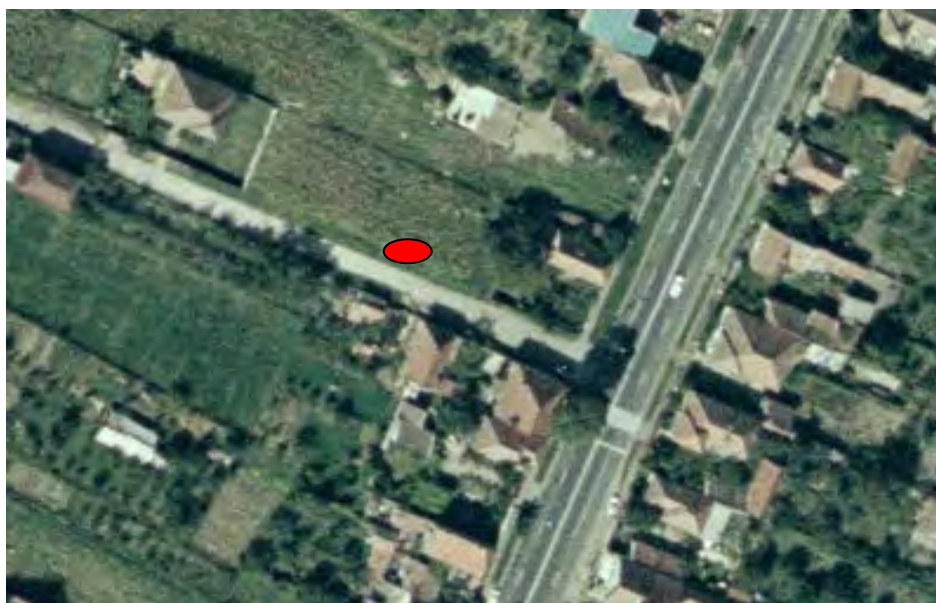
Fig. 4. Detaliu cu locul în care a fost descoperită statuia lui Hercule, în imediata apropiere a intersecției străzii Dacilor cu B-dul Reg. V Vânători.

La momentul descoperirii, unul dintre muncitori a sesizat în grămada de pământ silueta unei statui înfățișând un bărbat bărbos, dezbrăcat, marmura din care era confecționat fiind albă, foarte lucioasă, iar gamba piciorului stâng fiind ruptă de la genunchi. Bănuind faptul că ar putea fi vorba de o piesă valoroasă 17 , a decis, împreună cu un coleg 18 , să o ofere cadou inginerului coordonator, în speranța unor beneficii financiare.