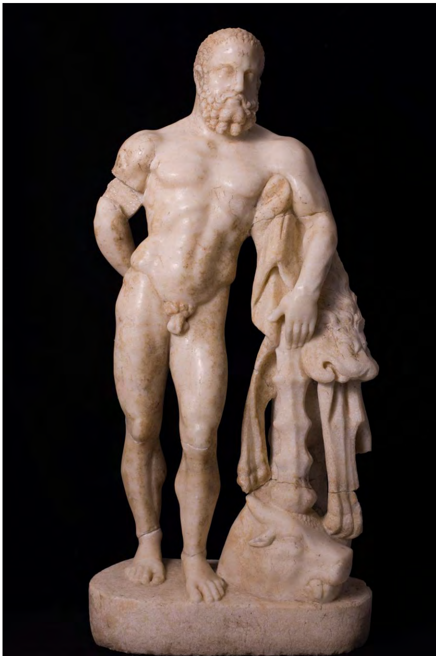
Fig. 7. Hercules descoperit în Colonia Aurelia Apulensis (vedere din față) 24 .