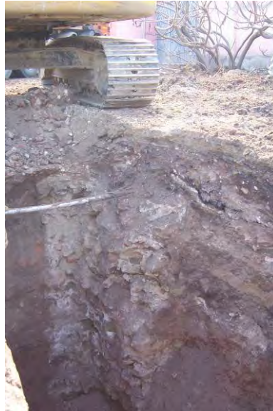
Fig. 10. Fotografie realizată la 26 martie 2012, la 2-3 zile după descoperirea statuii.

Spunem acest lucru deoarece, dacă urmărim cu atenție harta Josefînă ( Fig. 2 ), vom constata că în cea de a doua jumătate a secolului XVIII actualul cartier se reducea la un grup restrâns de locuințe grupate în extremitatea sa sudică, imediat lângă cursul râului Mureș, în apropierea podului care și-a păstrat locația până în ziua de astăzi. Se observă că vorbim despre cel mult 20 de gospodării, grupate radial în jurul unei clădiri ce pare a fi o biserică, aglomerație ce pare a fi legată mai degrabă de Oarda de Jos (Varadja) decât de orașul Alba Iulia. La vest de această aglomerare remarcăm o amenajare portuară, care se continuă cu o zonă mlăștinoasă extinsă, improprie locuirii, ce corespunde vechiului curs de vărsare al Ampoiului în Mureș. Spre nord, către oraș, înregistrăm lipsa oricărei amenajări umane, realitate pe care o asociem unei perioade de timp extinse.