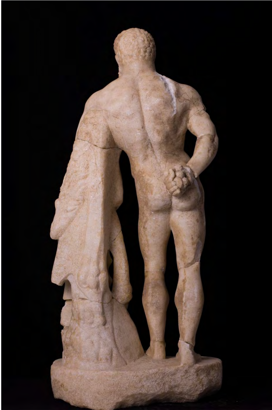
Fig. 8. Hercules descoperit în Colonia Aurelia Apulensis (vedere din spate).