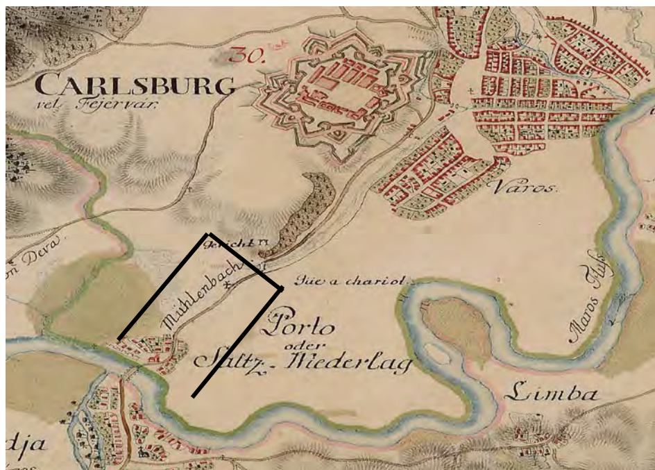
Fig. 2. Reprezentarea arealului cartierului Partoš în Harta Josefină. Cu negru, delimitarea Colonia Aurelia Apulensis .

Nu sunt cunoscute prea multe detalii cu privire la sfârșitul acestui oraș. Este de presupus că el a funcționat, la o scară mai redusă în preajma și după retragerea aureliană 13 . Cert este faptul că, spre deosebire de restul orașului Apulum ( Fig. 1-2 ), Partoșul a avut marele avantaj, din perspectiva arheologică (!), de a nu fi fost suprapus de alte locuiri umane până în secolul XVIII-XIX ( Fig. 2 ).