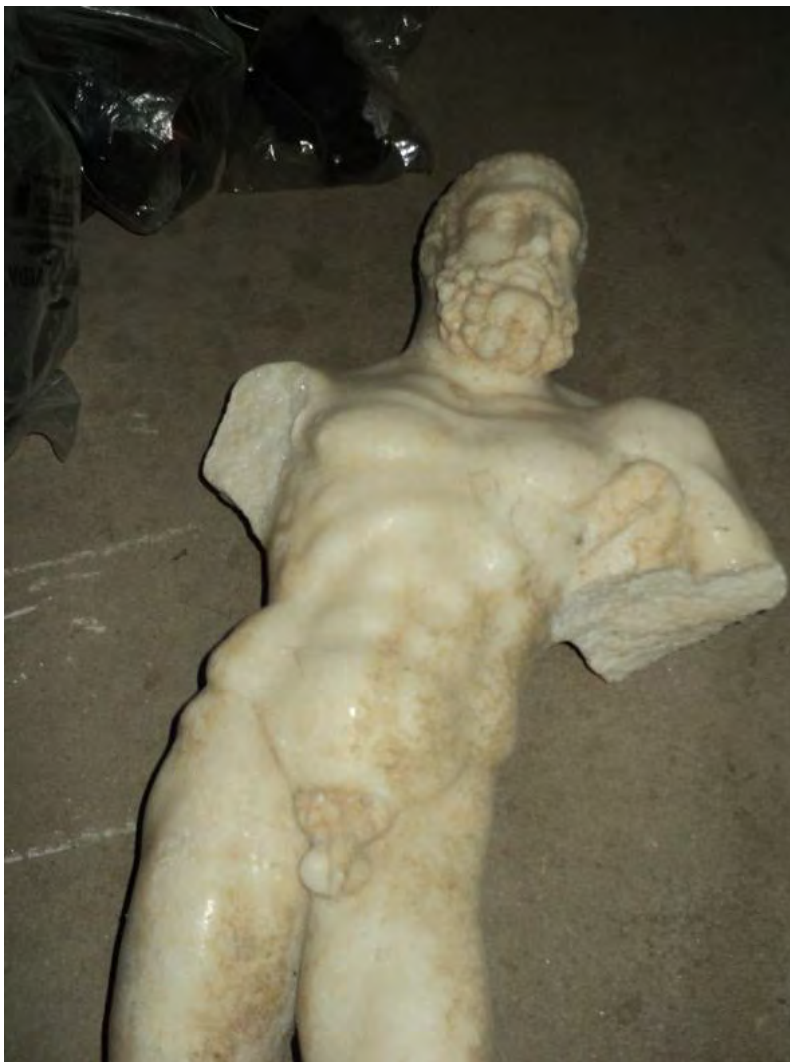
Fig. 5. Piesa sustrasă, fotografiată de inginer, în pivnița casei, unde a stat 1 an și 6 luni.

Lucru care s-a și întâmplat. De îndată ce a văzut statueta, inginerul 19 le-a dispus celor doi să o încarce în portbagajul autoturismului său, apoi s-a deplasat la domiciliul său din Alba Iulia, unde a depus-o în subsol, cu gândul ca, atunci când va avea nevoie de bani, să o valorifice într-un anumit mod.