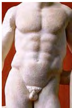
Fig. 12. Statueta lui Hercule – Bad Deutsch Altemburg. Muzeul Carnuntum Tors (detaliu).