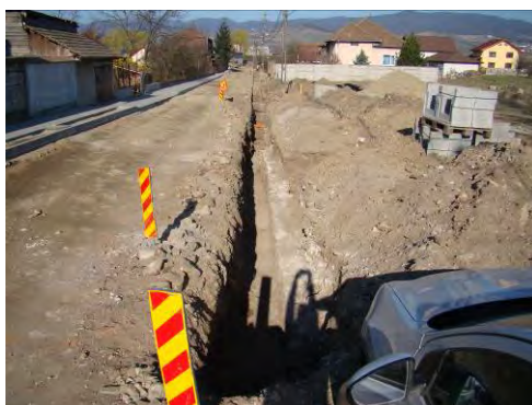
Fig. 18. Alba Iulia – Str. Dacilor . vedere generală (est) a cercetărilor arheologice.