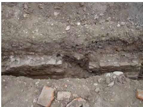
Fig. 20. Alba Iulia – Str. Dacilor – fundațiile a două socluri monumentale de statui.