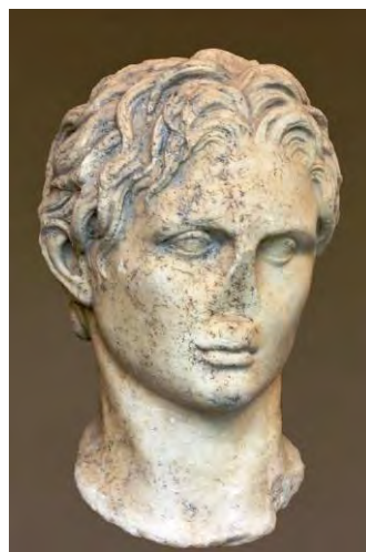
Fig. 9. Portretul lui Alexandru cel Mare – Villa Hadriana , Tivoli – Glyptoteka Munchen.