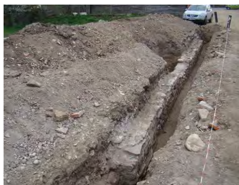
Fig. 19. Alba Iulia – Str. Dacilor .- zid longitudinal din piatră de râu și mortar.