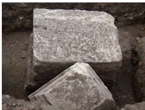
Fig. 23. Alba Iulia – Str. Dacilor – soclu monumental de statuie, cu fundații de piatră de râu; bază de statuie cu decor profilat.