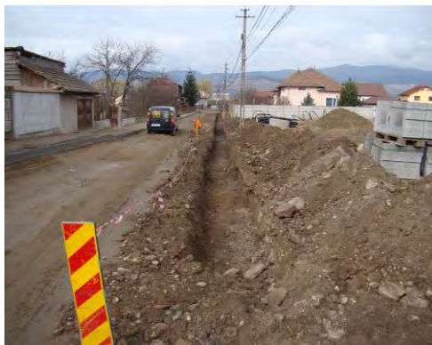
Fig. 16. Alba Iulia – Str. Dacilor . vedere generală (est) înaintea cercetărilor arheologice.