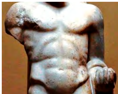
Fig. 13. Statueta lui Hercule – Muzeul Varna Tors (detaliu).