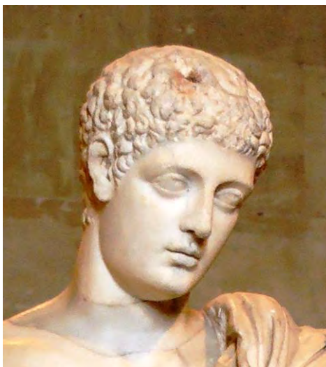
Fig. 7. Hermes „Richelieu” – Capul (detaliu).