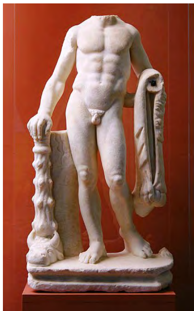
Fig. 10. Statueta lui Hercule – Bad Deutsch Altemburg. Muzeul Carnuntum.