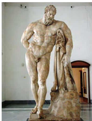
Fig. 4. Hercule „Farnese” - Statuie de marmură - Termele lui Caracalla, Roma