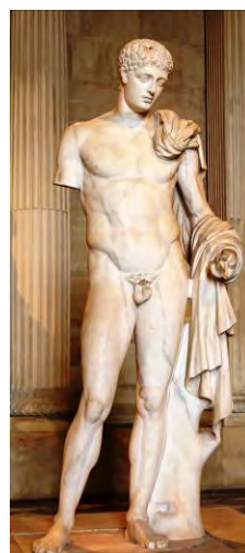
Fig. 5. Hermes „Richelieu” – Statuie de marmură – Muzeul Luvru.