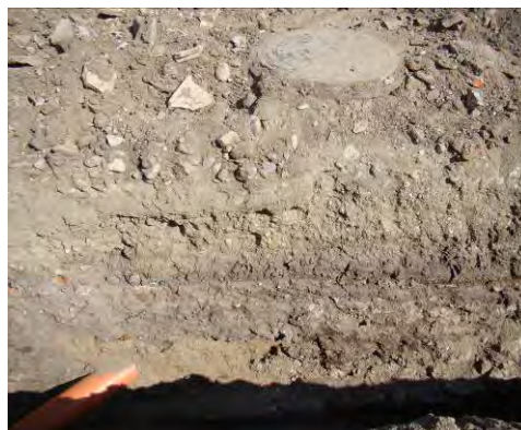
Fig. 25. Alba Iulia – Str. Dacilor – elemente de stratigrafie, perete nord.