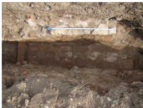
Fig. 21. Alba Iulia – Str. Dacilor – pavaj roman din cărămizi.