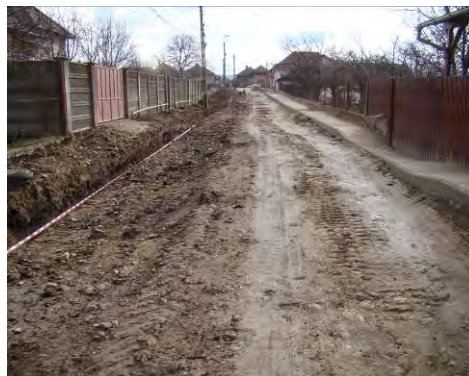
Fig. 17. Alba Iulia – Str. Dacilor . vedere generală (vest) înaintea cercetărilor arheologice.