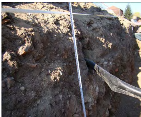
Fig. 26. Alba Iulia – Str. Dacilor – elemente de stratigrafie, perete sud.