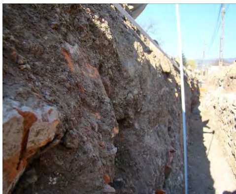
Fig. 24. Alba Iulia – Str. Dacilor – elemente de stratigrafie, perete sud.