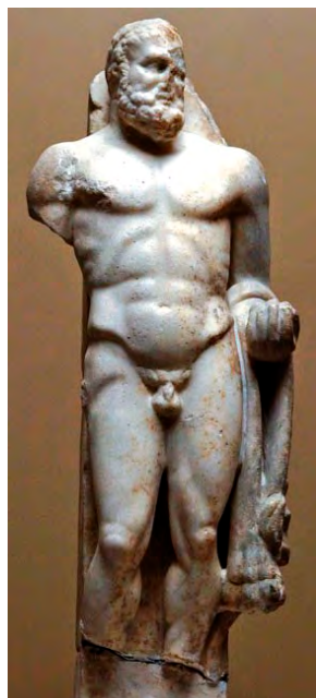
Fig. 11. Statueta lui Hercule – Muzeul Varna.