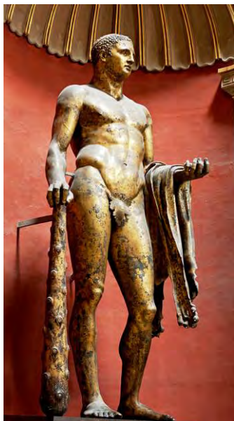
Fig. 2. Hercule „Mastai”- Statuie de bronz – Teatrul lui Pompei, Roma.