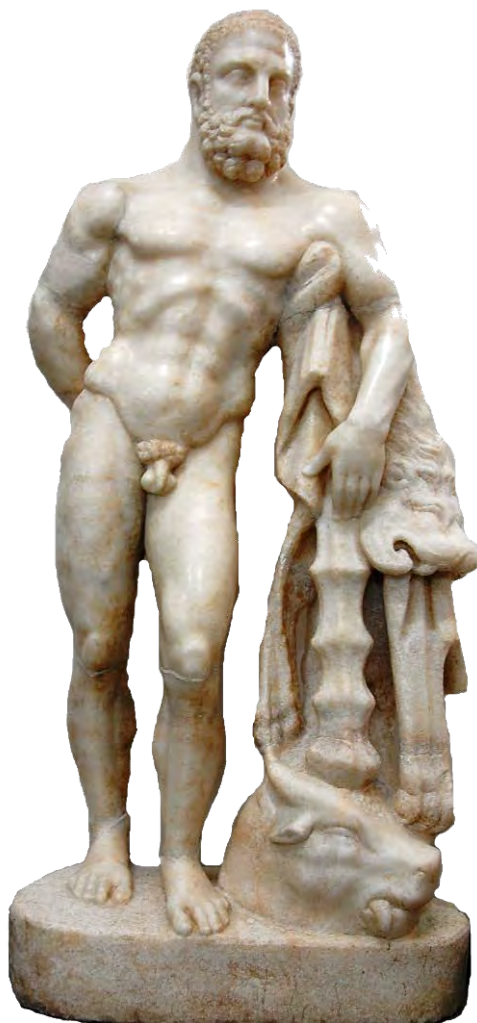
Fig. 1. Statueta lui Hercule descoperită pe str. Dacilor, cartier Partoș, Alba Iulia, - vedere generală.

compoziției. Deși acest detaliu iconografic lipsește în cadrul tipului clasic al lui Hercule Farnese, în lumea provincială, vecină Daciei, acest detaliu se întâlnește totuși relativ frecvent. Analogiile stilistice, trecute în revistă în cadrul unei analize mai ample, au putut aduce la lumină observații extrem de utile în ceea ce privește datarea piesei în timpul epocii lui Hadrian și proveniența probabilă a acesteia dintr-un atelier din Asia Mică.