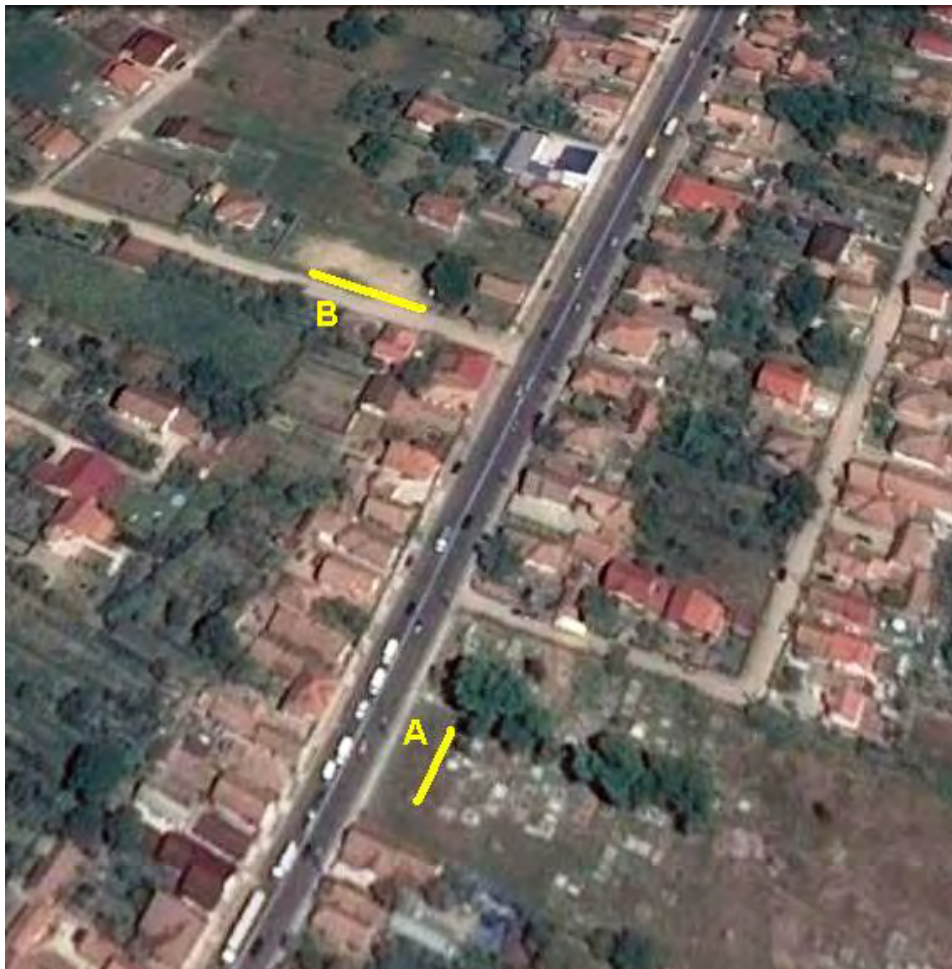
Fig. 14. Alba Iulia – Vedere generală a cartierului Partoș (A Cercetările arheologice din perimetrul cimitirului ortodox ; B Cercetările arheologice preventive str. Dacilor).