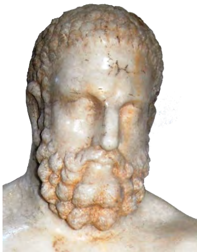
Fig. 6. Statueta lui Hercule – Apulum – Capul (detaliu).