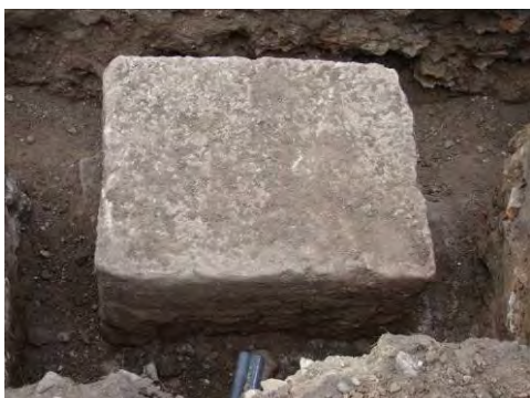
Fig. 22. Alba Iulia – Str. Dacilor – soclu monumental de statuie, cu fundații de piatră de râu.