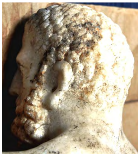
Fig. 8. Statueta lui Hercule – Apulum – Capul (detaliu).