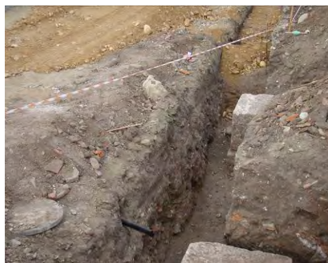
Fig. 27. Alba Iulia – Str. Dacilor – situația finală a lucrărilor și a vestigiilor conservate in situ .