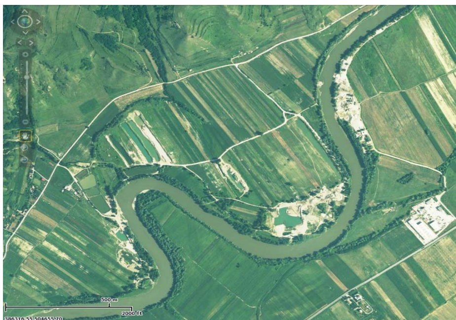
Fig. 3. Detaliu cu locul descoperirii celtului de bronz.