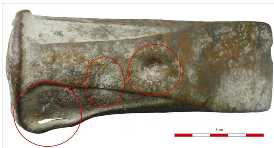
Fig. 5. Zonele cu urme de deformare intenționată de pe celtul de la Pâclișa.