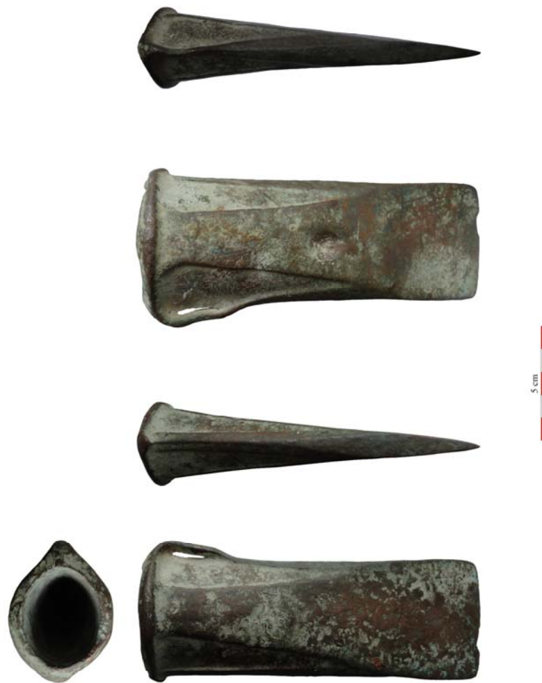
Fig. 4. Celtul de bronz descoperit la Pâclișa: fotografie. Scara 1/2.