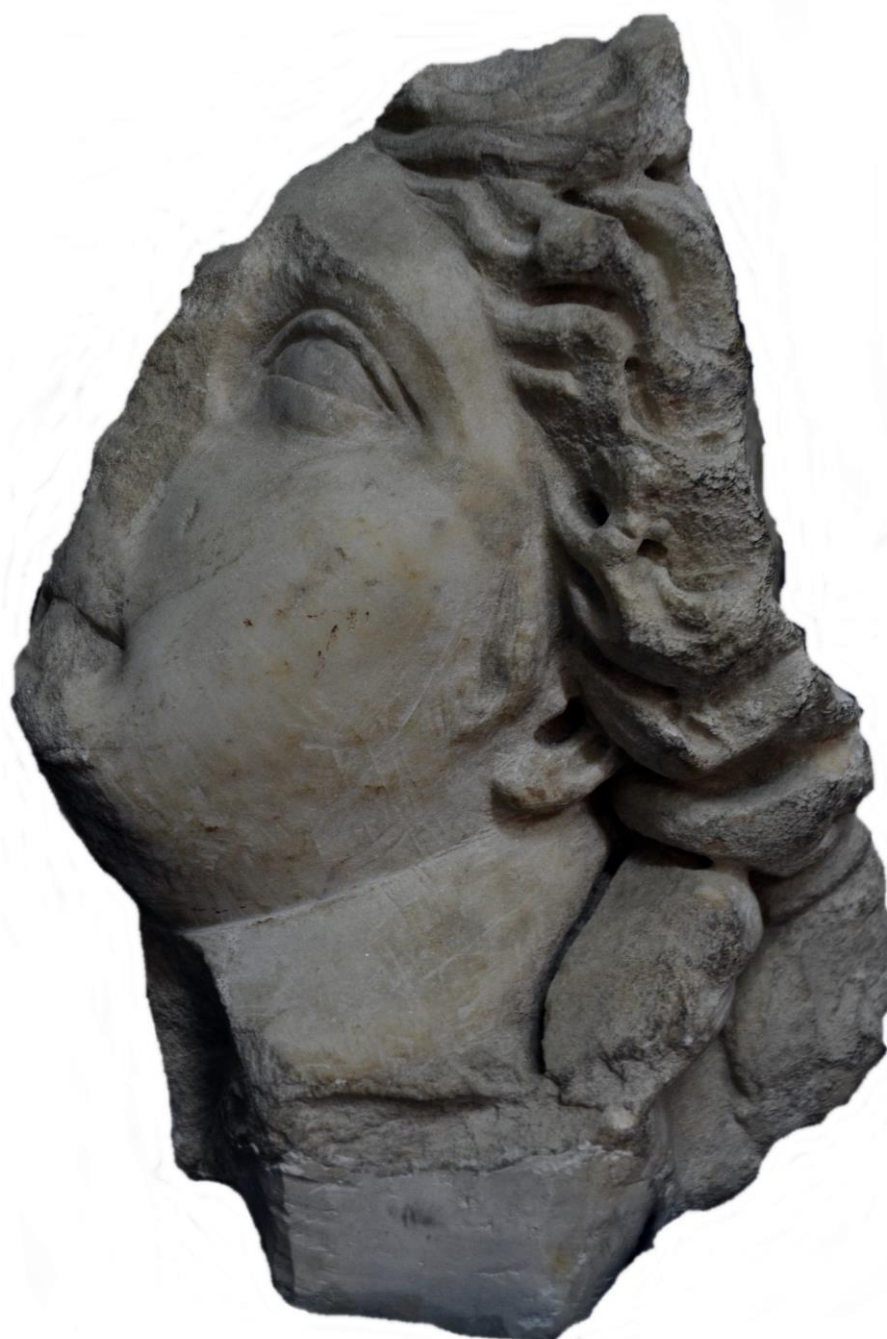
Fig. 2 – Cap de statuie votivă a lui Apollo Lykeios.