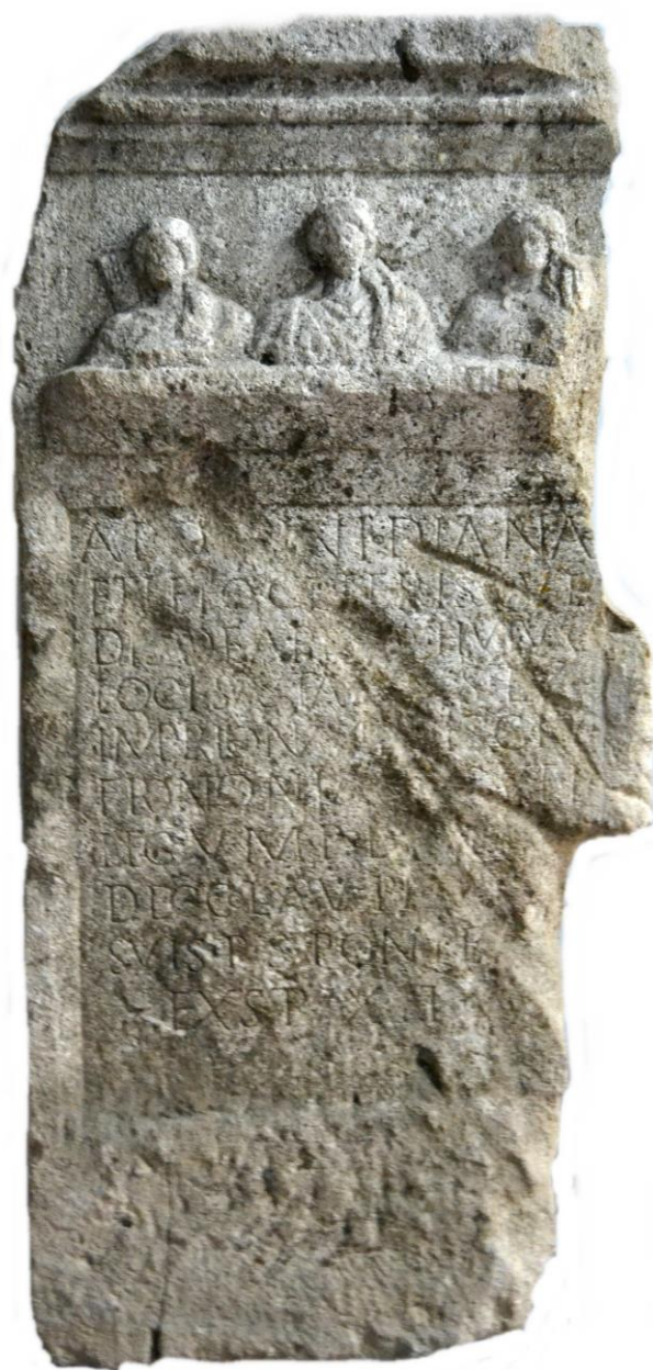
Fig. 4 – Relief votiv cu inscripție dedicat lui Apollo, Diana și Leto.