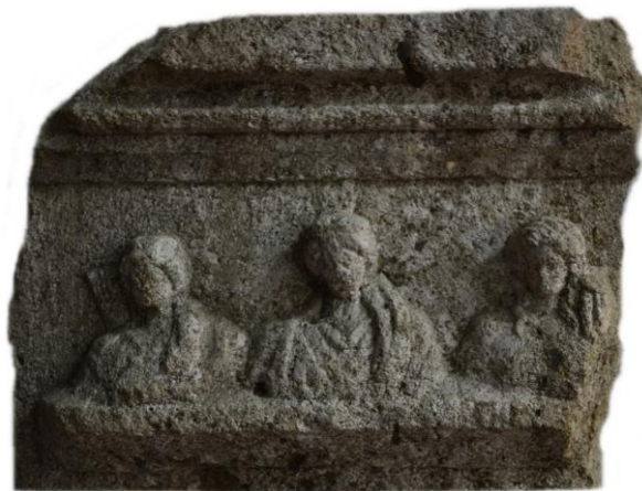
Fig. 5 – Relief votiv cu inscripție dedicat lui Apollo, Diana și Leto - detaliu.