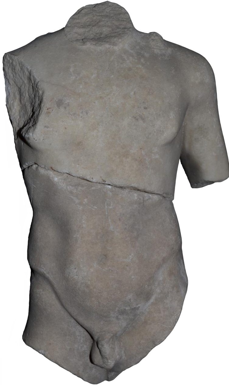
Fig. 3 – Statuetă votivă a lui Apollo.