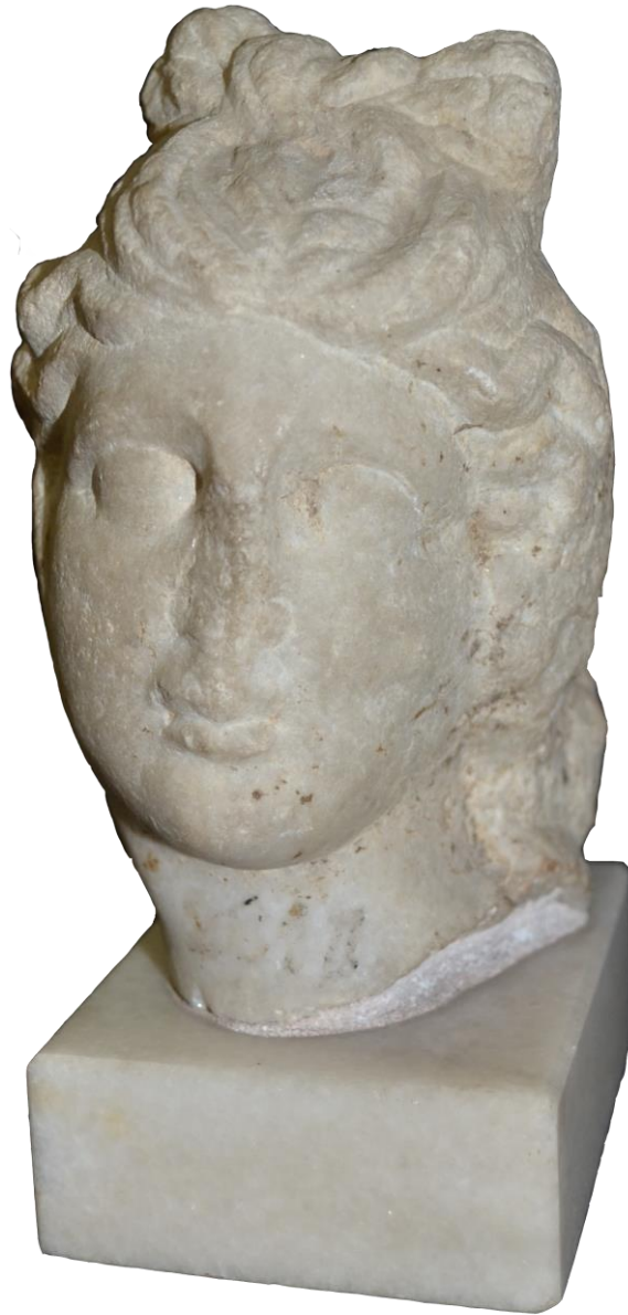
Fig. 1 - Cap de statueta votivă a lui Apollo Belvedere.