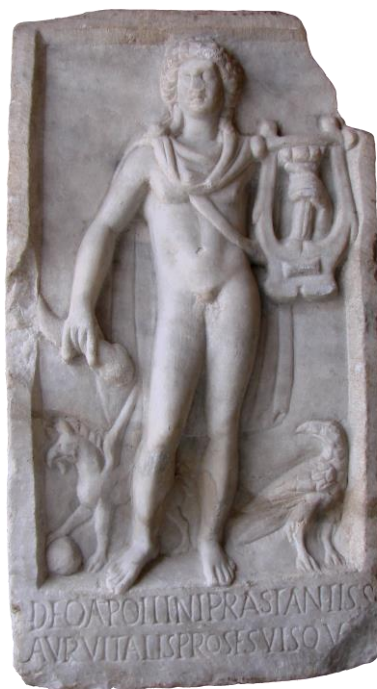
Fig. 6 – Tăbliță votivă cu inscripție dedicată lui Apollo Citharoedus.