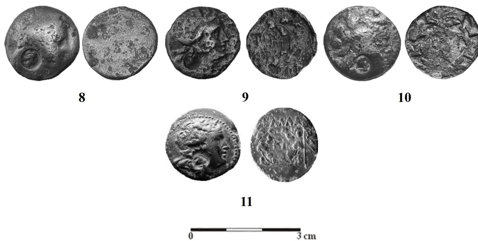
Fig. 2. Monede bătute la Callatis din tipul Dionysos/cunună (nr. 8-11)