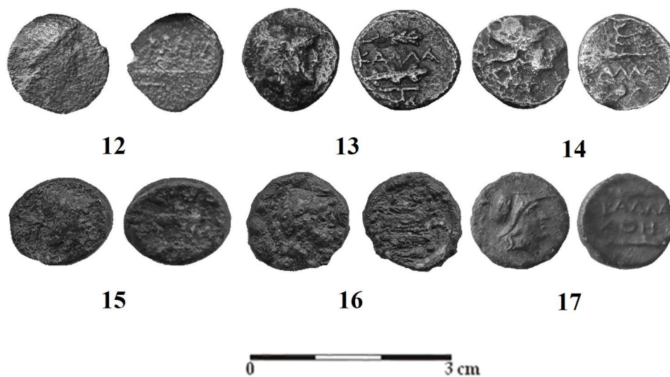
Fig. 3. Monede bătute la Callatis din tipurile Artemis (nr. 12) și Athena (nr. 13-17)