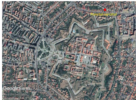
Fig. 1. (prelucrare după Google Earth Pro, accesat ultima oară în 25.05.2020, orele 11)