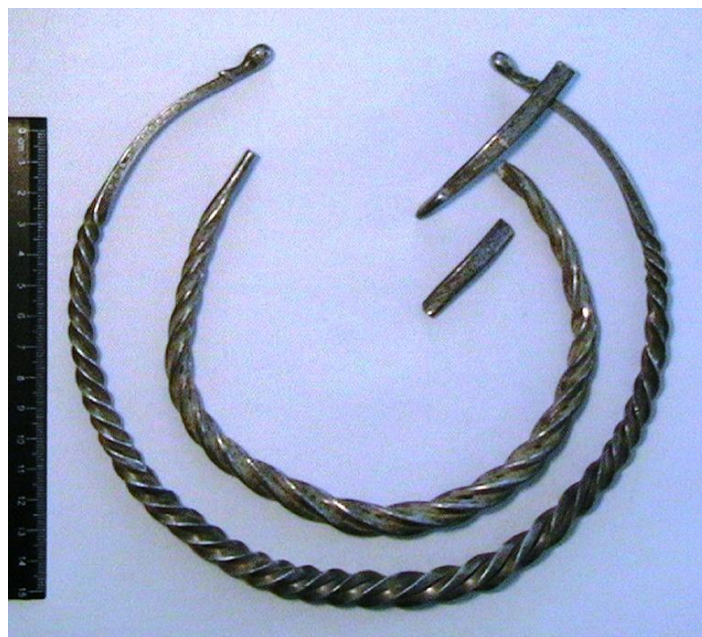
Fig. 10. Colane torsadate ( torques ) din argint, cu extremități zoomorfe (sec II-I a.Chr.).