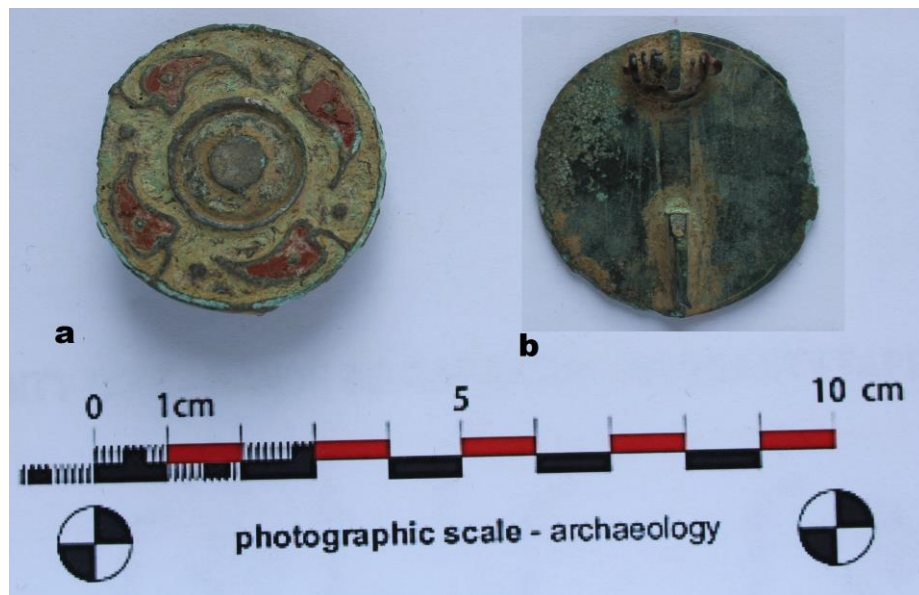
Fig. 14. Fibulă din bronz, cu decor vegetal policrom (sec. II p.Chr.) (a. față, b. spate).