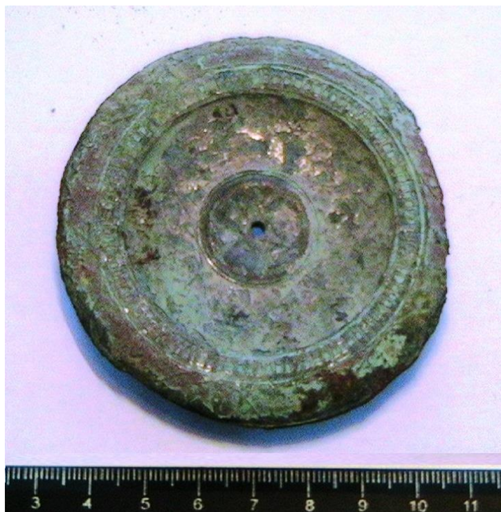
Fig. 11. Disc ( falera ) din argint, cu ornamente vegetale și geometrice (sec. I p.Chr.).