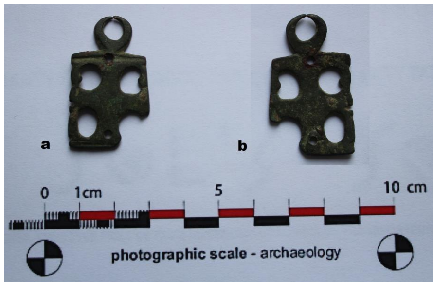
Fig. 15. Aplică de centură din bronz (sec. II-III p.Chr.) (a. față, b. spate).