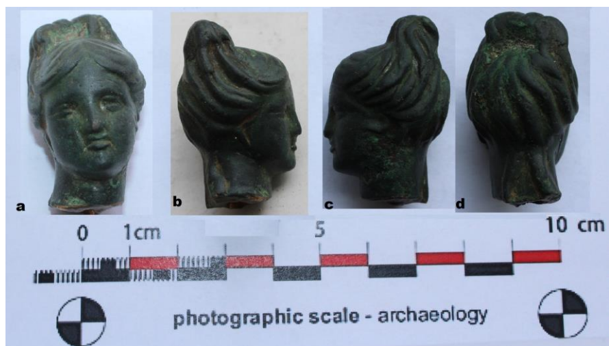
Fig. 12. Cap de statuță (Artemis) din bronz (tradiție hellenică, sec. III-II a.Chr.).