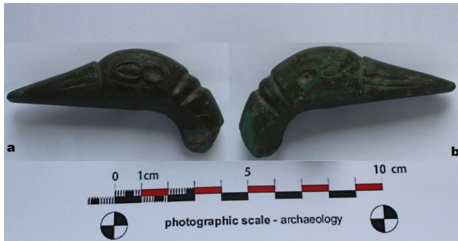
Fig. 13. Fragment de polonic ( simpulum ) din bronz, cap de pasăre acvatică (lebedă?) (sec. I p.Chr.) (a. lateral dreapta, b. lateral stânga).