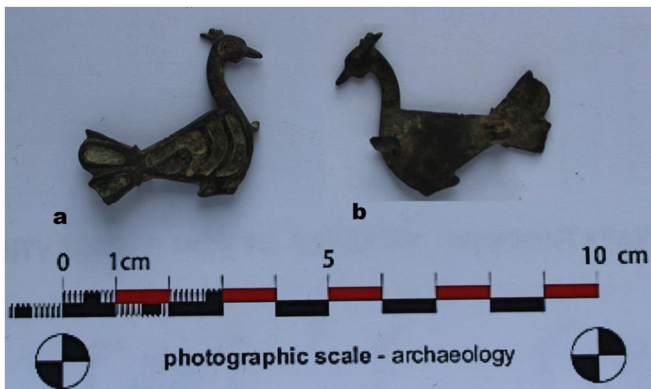
Fig. 18. Fibulă zoomorfă (păun) din bronz cu ornamente cromatice (sec. II p.Chr.) (a. față, b. spate).