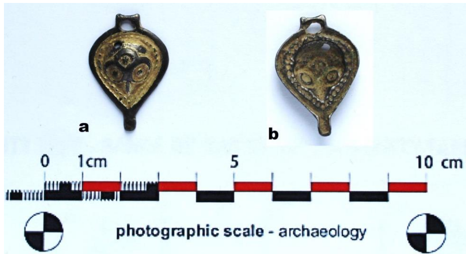
Fig. 17. Aplică de centură din argint aurit, cu ornamente stilizate (sec. X) (a. față, b. spate).