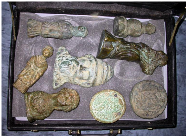
Fig. 1. Statuete din bronz și plachete ridicate de procurori (25.01.2006).