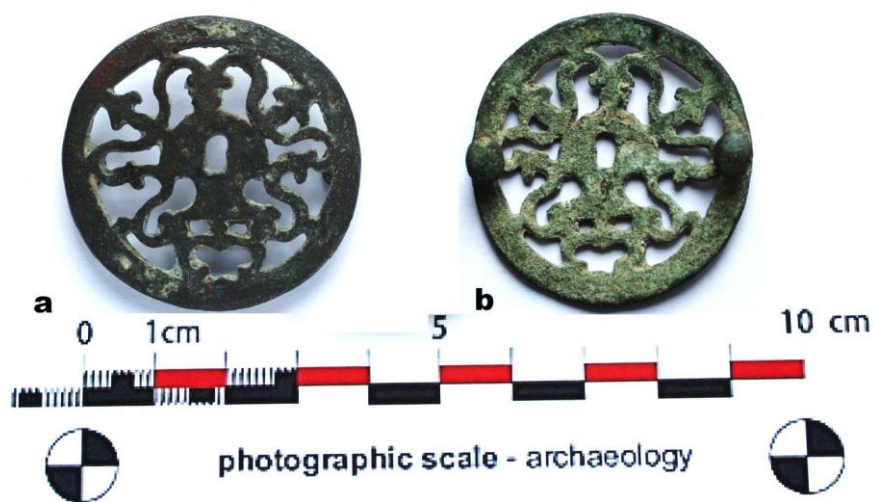
Fig. 16. Aplică ( fibula? ) din bronz, cu ornamente vegetale (sec III p.Chr.) (a. față, b. spate).