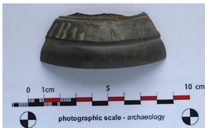
Fig. 21. Fragment de clopot, din bronz.