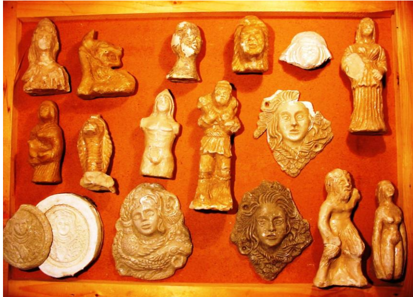
Fig. 9. Tipare și modele expuse la Muzeul din Alba Iulia.