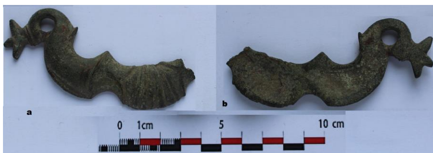
Fig. 20. Mâner de casetă, din bronz (sec. II-III p.Chr) (a. față, b. spate).