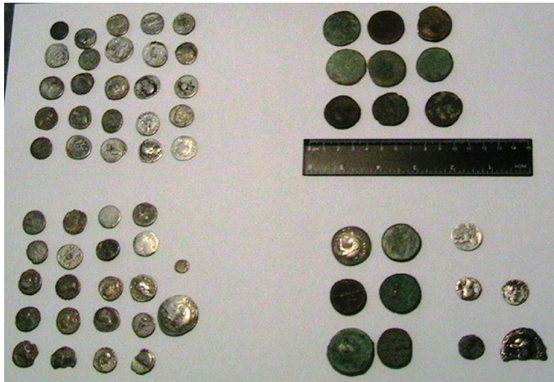
Fig. 3. Monede din argint și bronz (67), ridicate de procurori (25.01.2006).