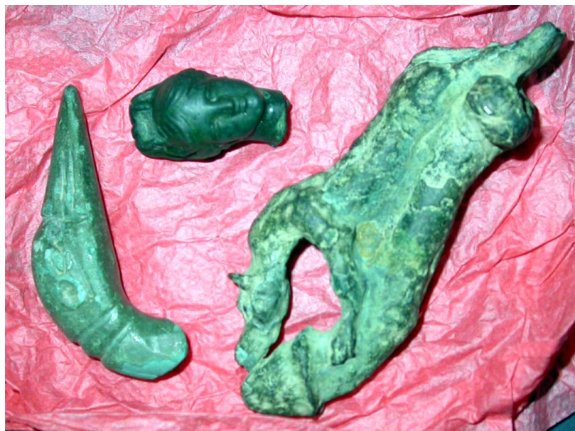
Fig. 4. Statuete fragmentare și zoomorfe, ridicate de procurori (25.01.2006).