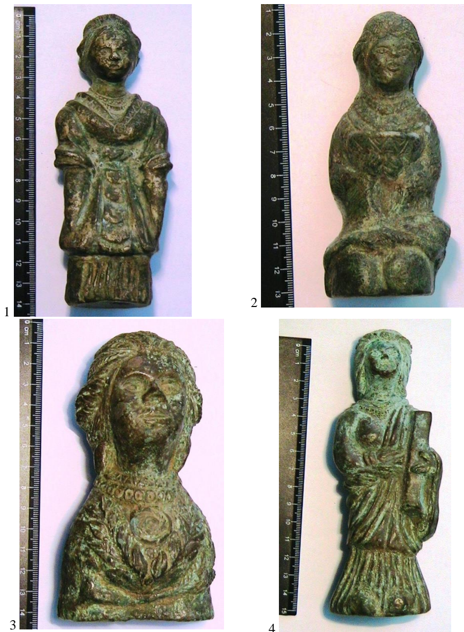
Fig. 5. Statuete din bronz reprezentând personaje feminine, ridicate de procurori (25.01.2006).