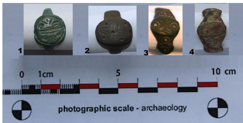
Fig. 19. Inele medievale din bronz și cupru (sec. XII-XV).