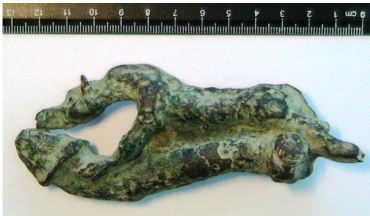
Fig. 7. Statuetă zoomorfică (faliformică?).