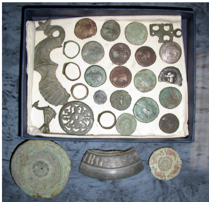
Fig. 2. Monede, inele, aplici și fragment de clopot, ridicate de procurori (25.01.2006).