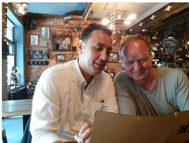
Fig. 2. O întâlnire la Cluj în anul 2017.