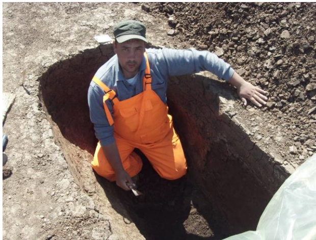
Fig. 6. Săpând un complex arheologic cu ocazia săpăturilor de salvare de pe traseul autostrăzii de Timișoara-Arad (2010).