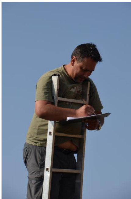
Fig. 4. Pe șantierul arheologic de la Cornești (2015).