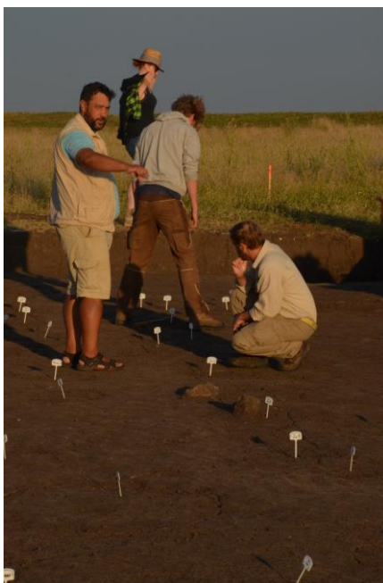
Fig. 5. Coordonând săpăturile de la Cornești (2015).