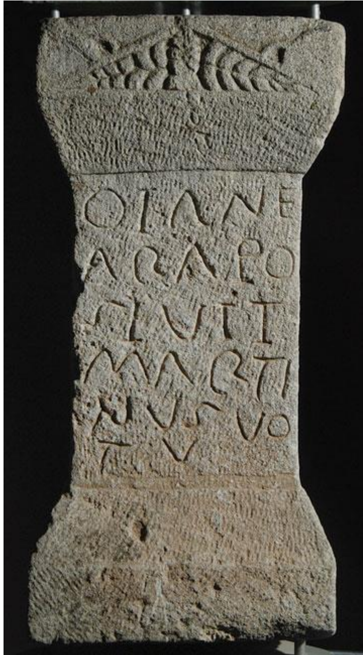
Fig. 12.