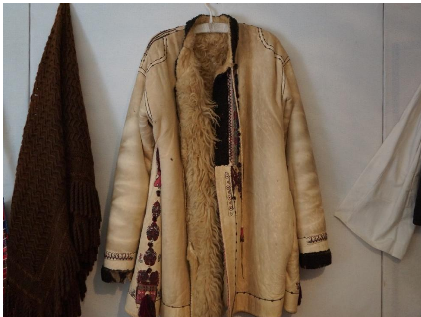
Fig. 10. Cojoc lung cu clini (Biia)