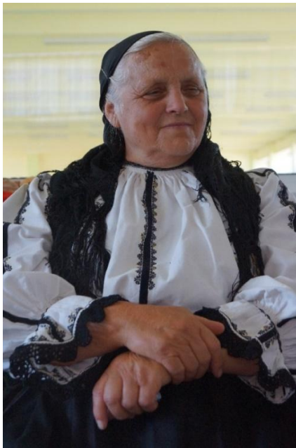
Fig. 13. Port femeiesc (Biia)