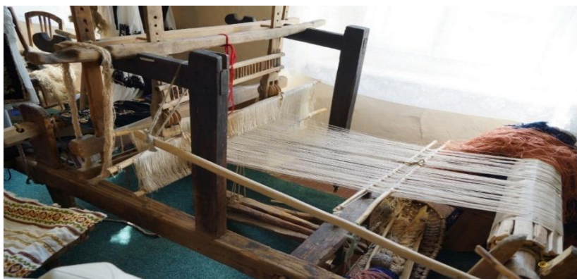
Fig. 2. Război de țesut (Biia)