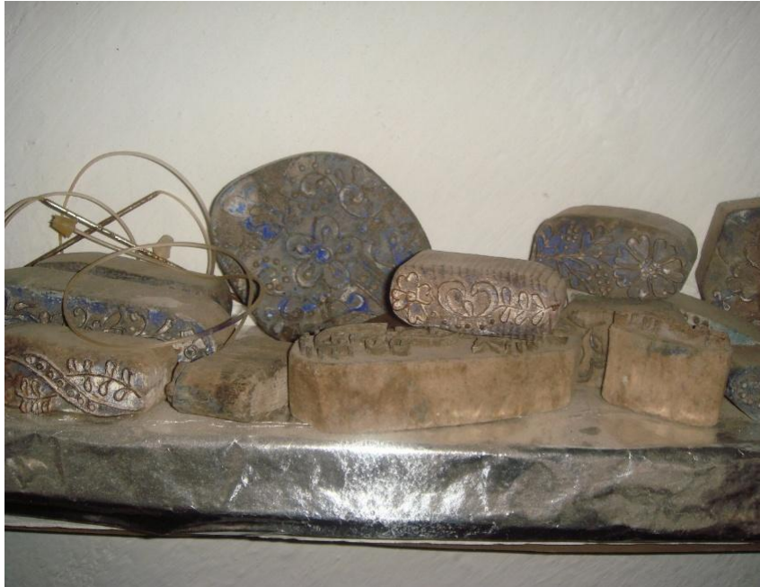
Fig. 8. Ștațe pentru pielărit (Teiuș)