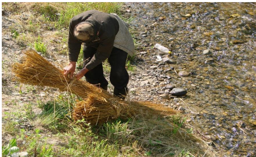
Fig. 3. Formarea mănunchiului de cânepă