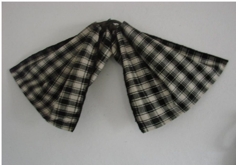
Fig. 6. Desagi (Cenade)