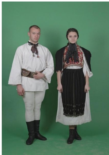
Fig. 16. Port săsesc bărbătesc și femeiesc (Cenade)