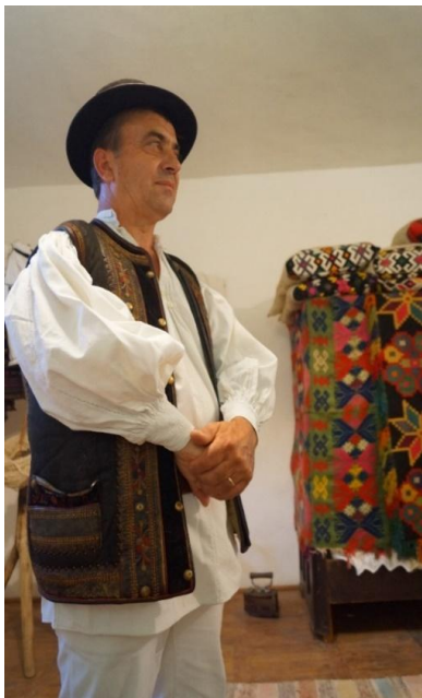
Fig. 12. Port bărbătesc (Sâncel)