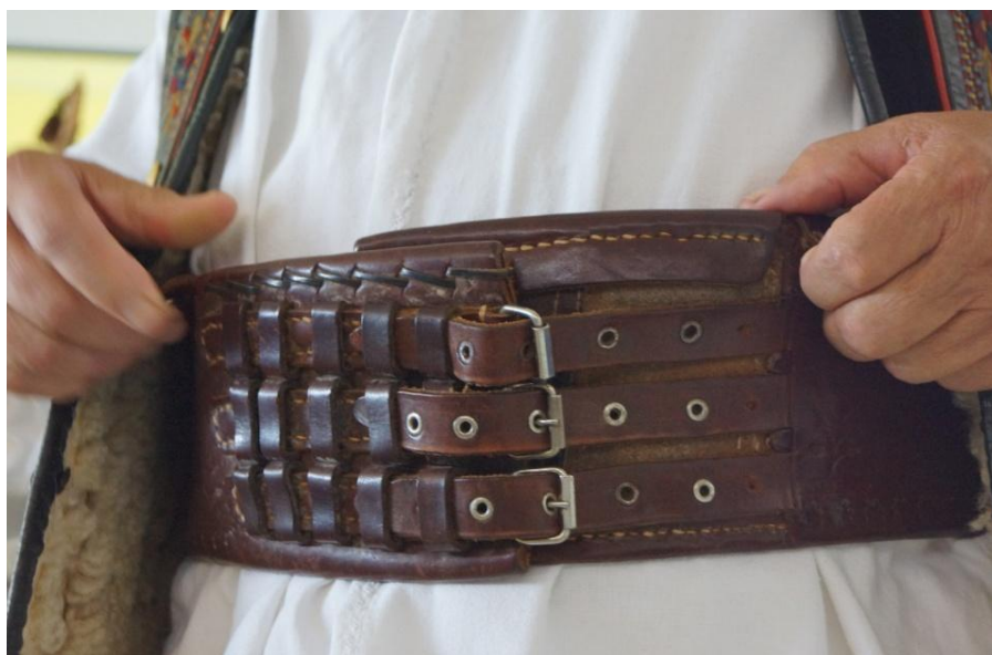
Fig. 7. Șerpar (Biia)