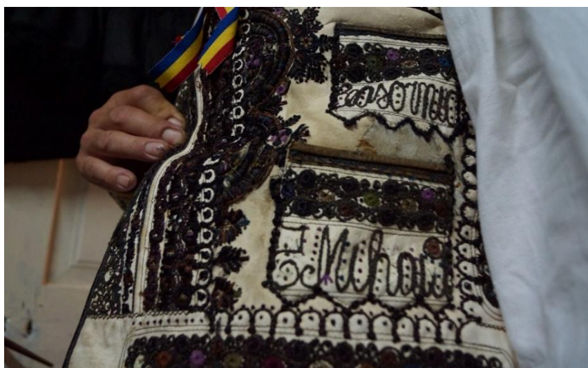
Fig. 11. Pieptar bărbătesc (Cetatea de Baltă)