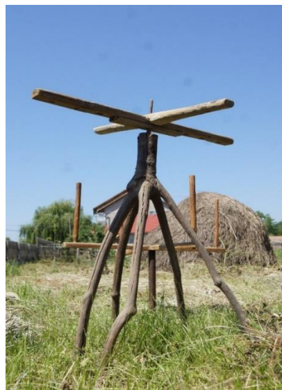
Fig. 5. Vârtelniță (Sâncel)