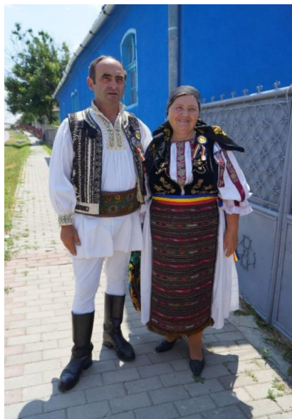
Fig. 14. Port bărbătesc și femeiesc (Cetatea de Baltă); Fig. 15. Port românesc bărbătesc și femeiesc (Cenade)