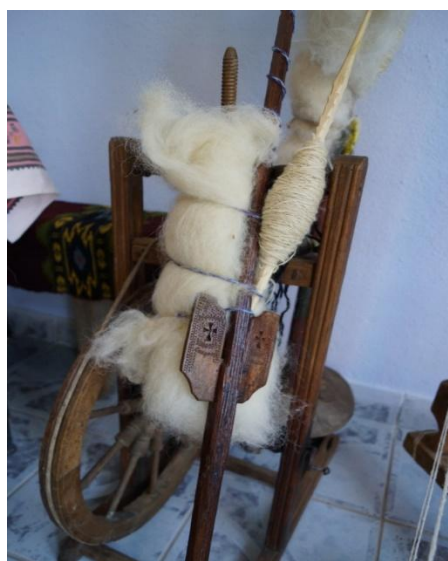
Fig. 4. Roată și furcă de tors (Sâncel)