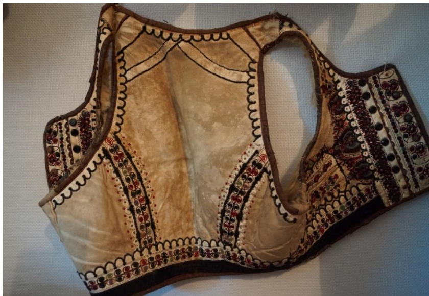
Fig. 9. Pieptar femeiesc (Cenade)