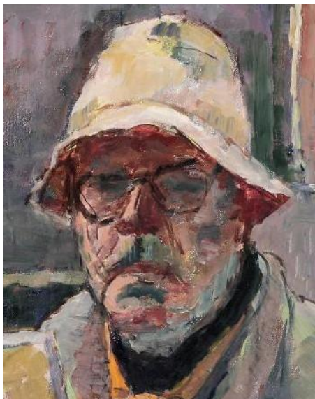
Foto 7. Aurel Ciupe, artist și muzeograf ( https://ro.wikipedia.org )