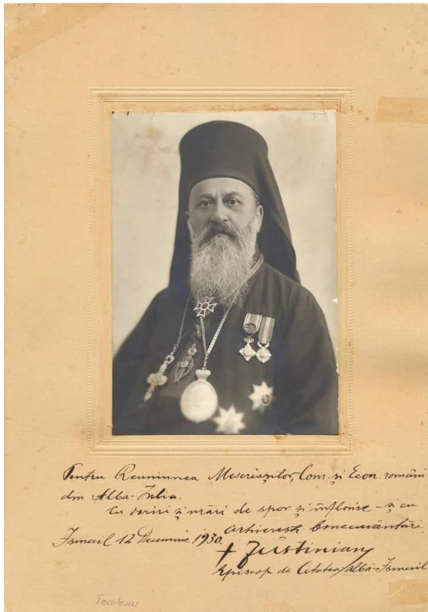
Fig. 4 – Fotografie a Episcopului Justinian Teculescu al Cetății Albe – Ismail, fost președinte al Reuniunii între anii 1903 și 1906. Fotografia este însoțită de o dedicație pentru Reuniunea Meseriașilor, Comercianților și Economilor Români din Alba Iulia, Ismail, 12 Decembrie 1930 (colecția Muzeului Național al Unirii Alba Iulia, inv. CF 4019)