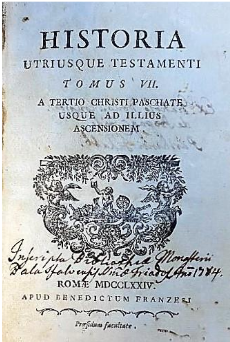
Fig. 2 - Foaia de titlu a lucrării Historia utriusque testamenti , vol. VII-VIII, Roma, 1774