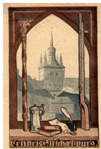
Fig. 3 -Ex-Libris Alt-Schäßburg