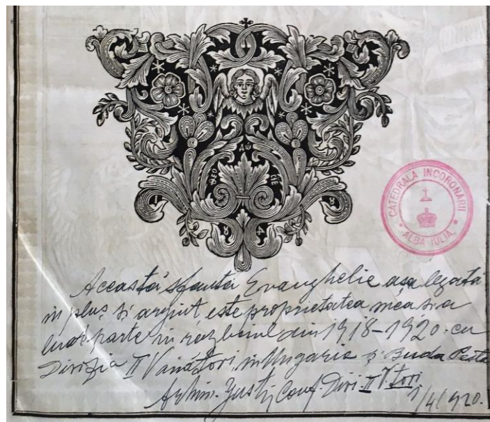
Fig. 3 – Însemnare redactată de preotul Justin Șerbănescu