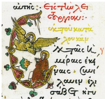
Fig. 14 – Inițiala E