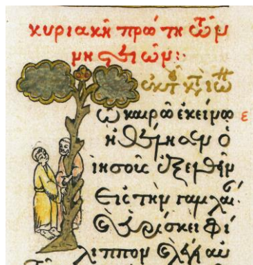
Fig. 20 - Inițiala T