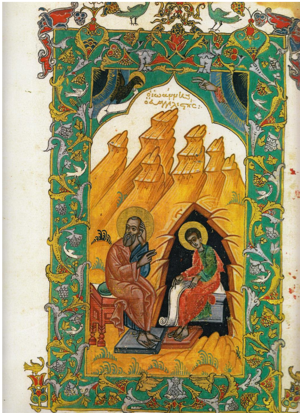
Fig. 1 - Evanghelistul Ioan