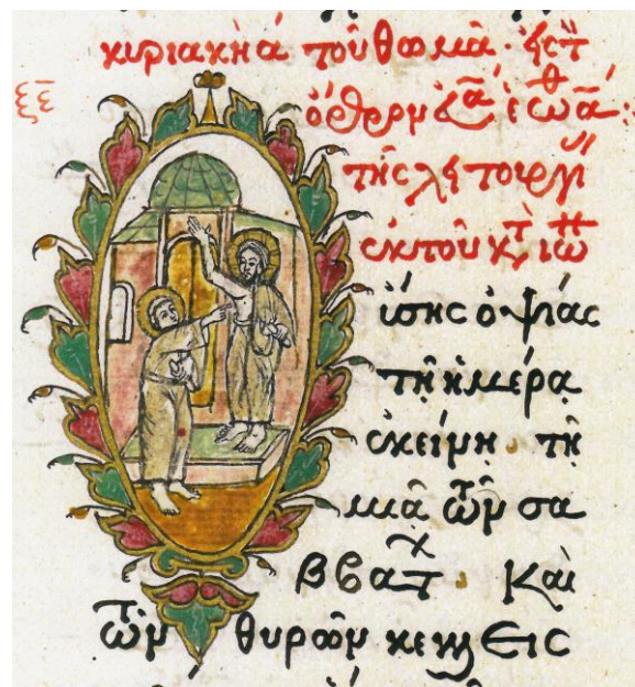
Fig. 9 - Toma pipăie coasta Domnului Hristos - Inițiala O