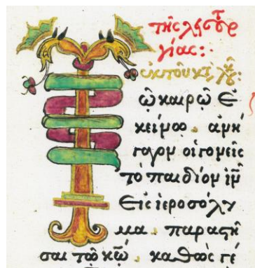
Fig. 21 - Inițiala T