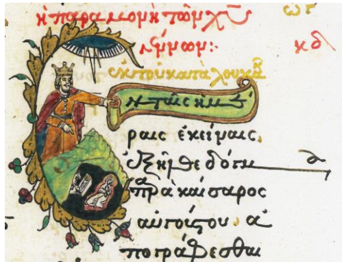
Fig. 13 – Inițiala E