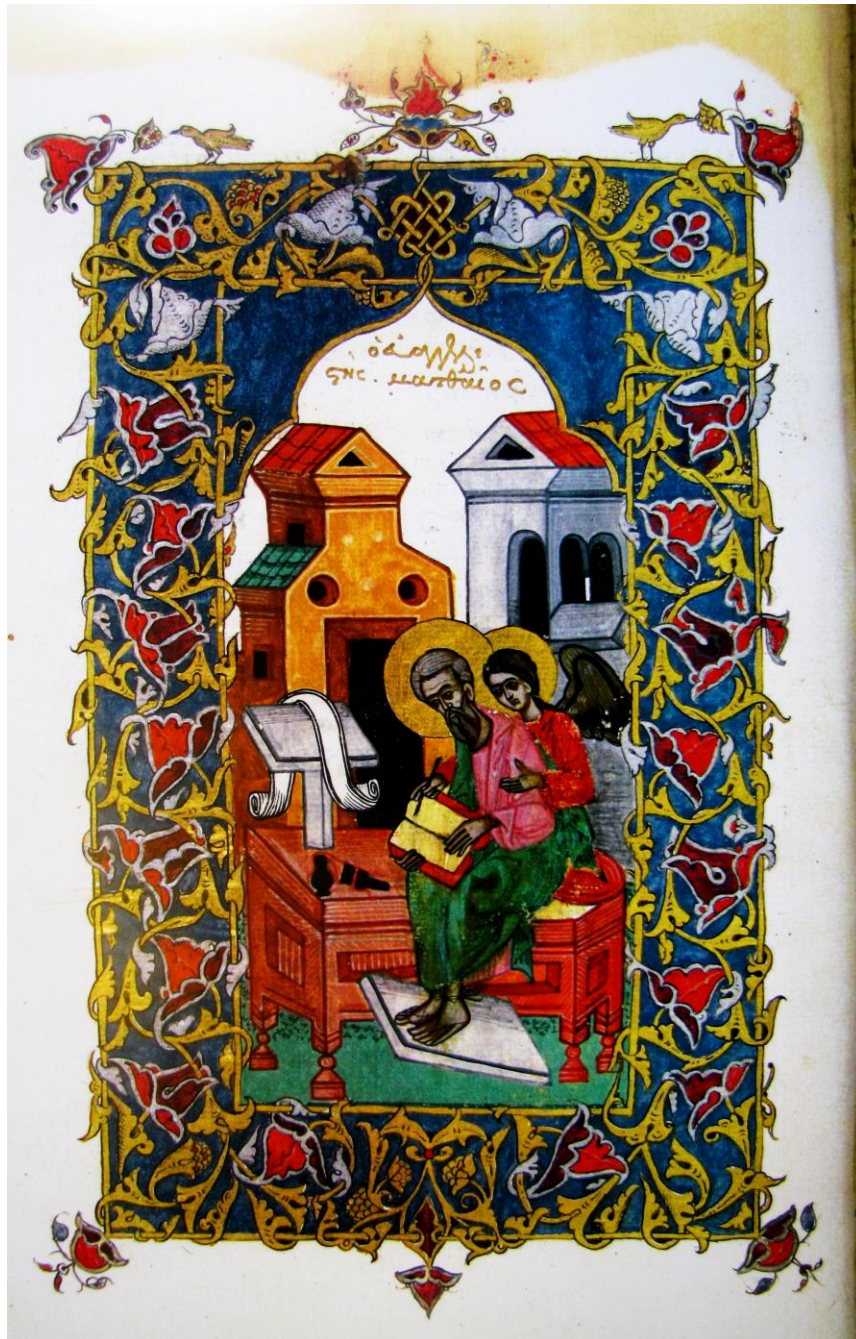
Fig. 2 - Evanghelistul Matei