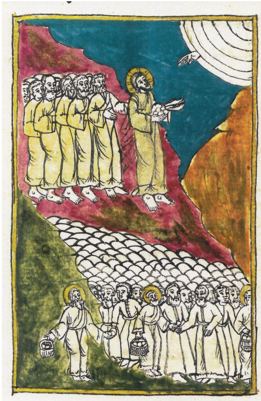
Fig. 4 - Iisus înmulțește pâinile