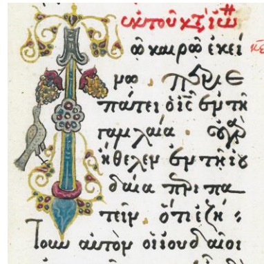
Fig. 16 - Inițiala T