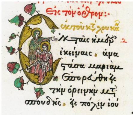
Fig. 12 – Inițiala E