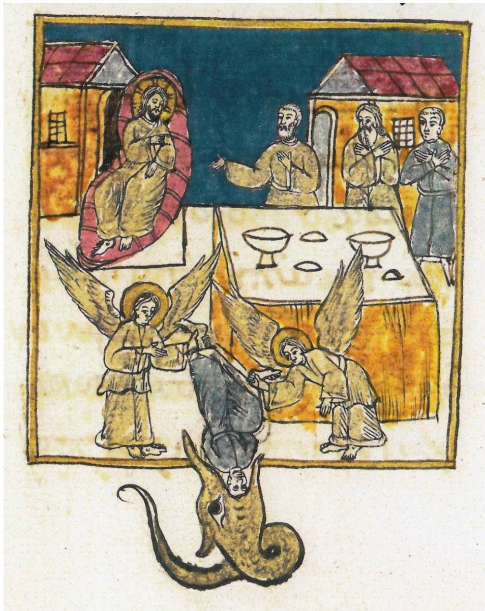
Fig. 5 - Pilda nunții fiului de împărat, cel fără haină de nuntă este aruncat în gheena