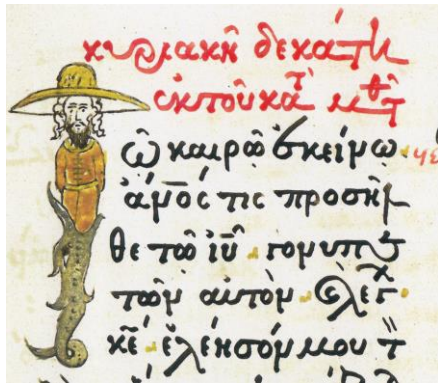
Fig. 15 - Inițiala T