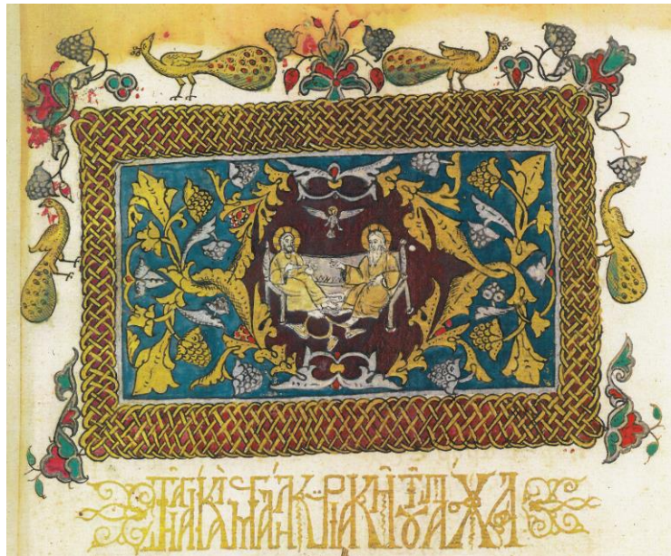
Fig. 8 - Sfânta Treime