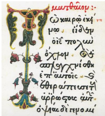
Fig. 17 - Inițiala T