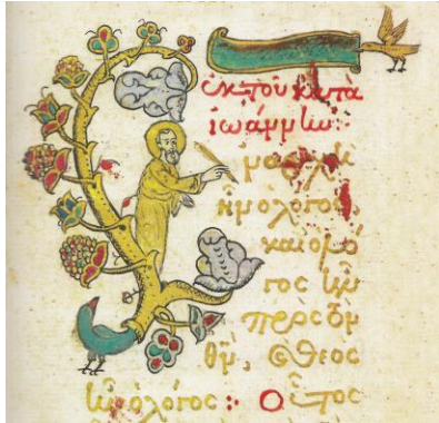
Fig. 10 – Inițiala E