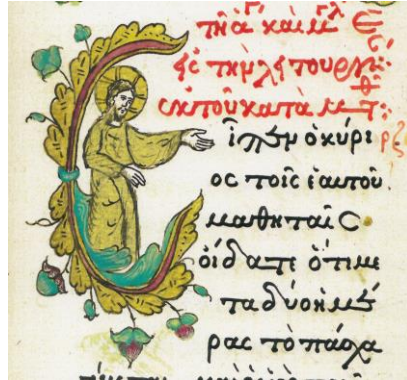
Fig. 11 – Inițiala E