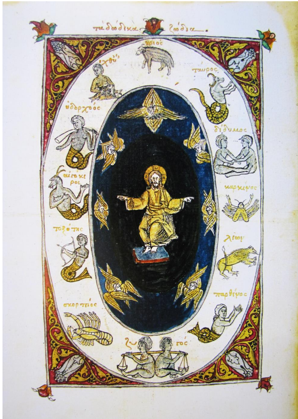
Fig. 6 – Zodiacul