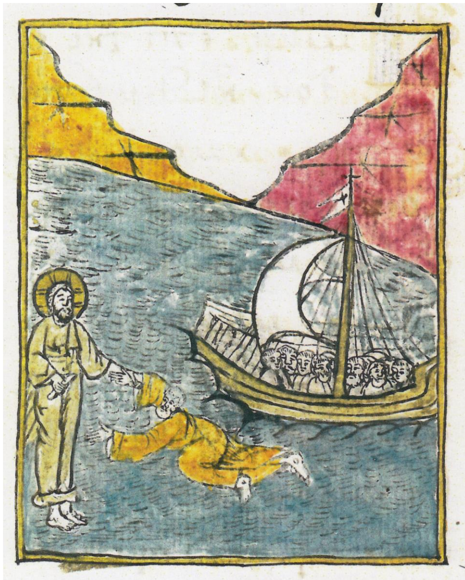
Fig. 3 - Iisus potolește furtuna iscată pe mare