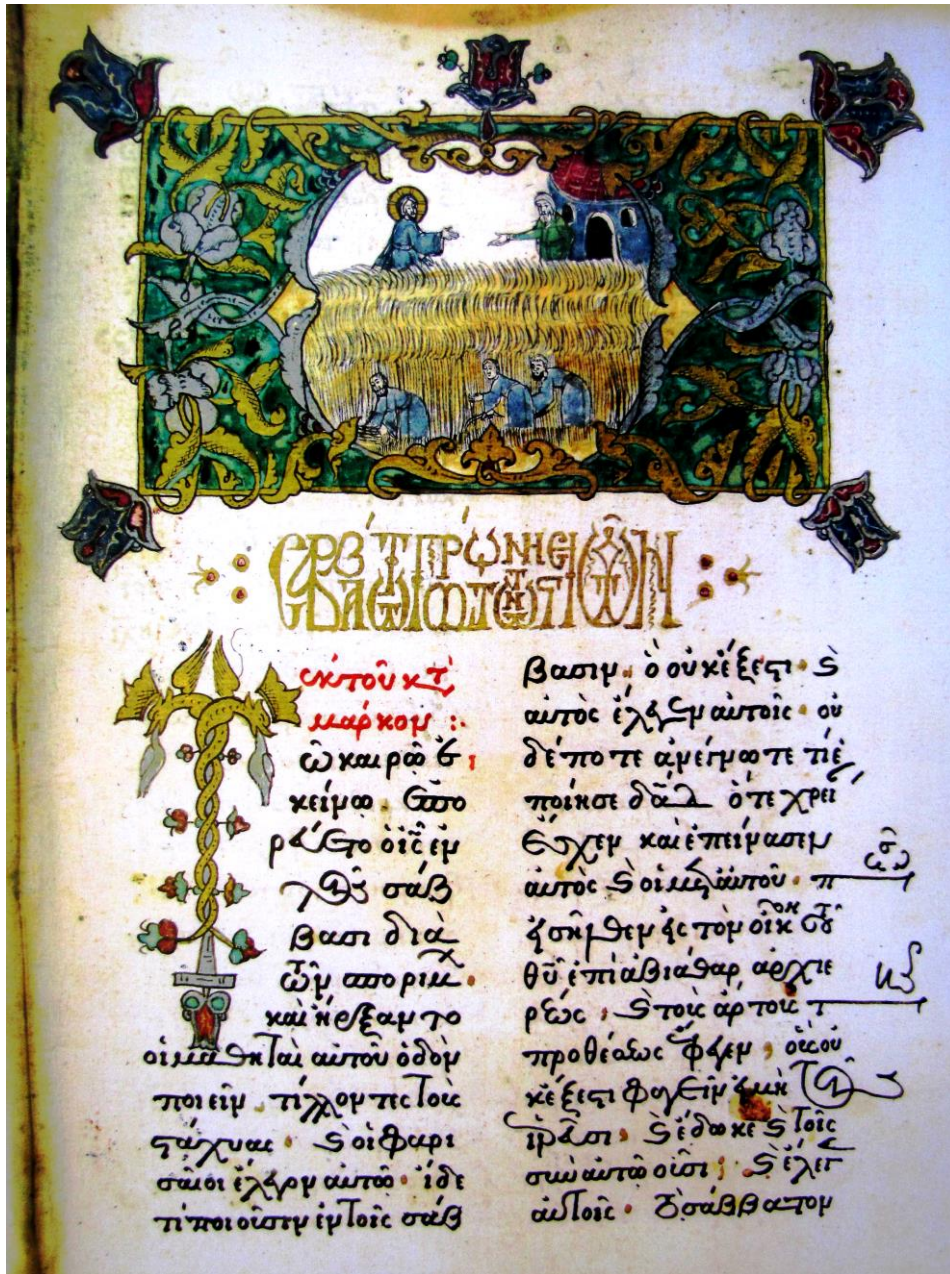
Fig. 7 - Frontispiciu la sămbăta întâi a Postului, ucenicii lui Iisus smulg spice din lan