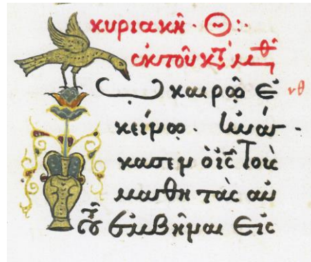
Fig. 18 - Inițiala T