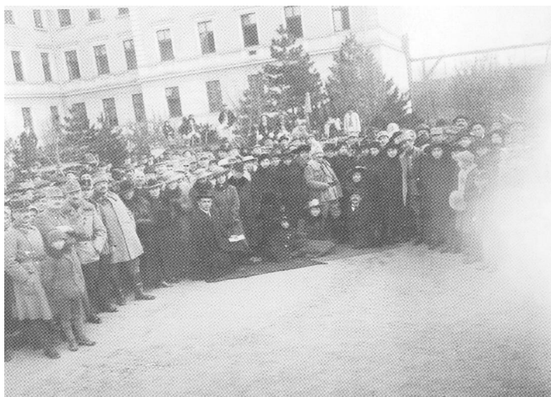
Fig. 11 - Aceiași poziție, unghi ușor diferit 43