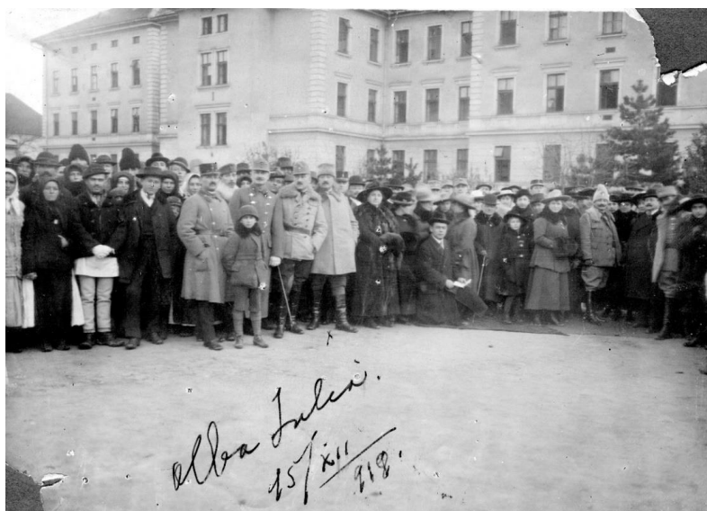
Fig. 9 - Armata română alături de Garda Naţională şi notabili ai oraşului în interiorul cetăţii 41