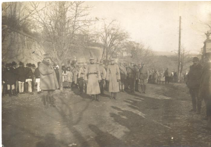
Fig. 1 - Trupele române urcând pe traseul porților, în dreptul actualei porți a II-a a cetății 33

Ordinea prezentării fotografiilor este una cronologică, cel puțin în ordinea în care bănuim că s-au întâmplat lucrurile.