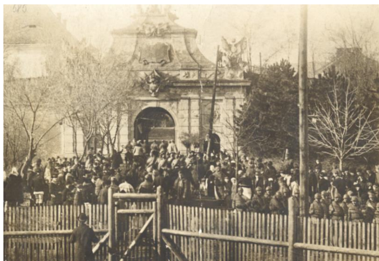
Fig. 4 - Intrarea trupelor române pe poarta a III-a a cetății 36