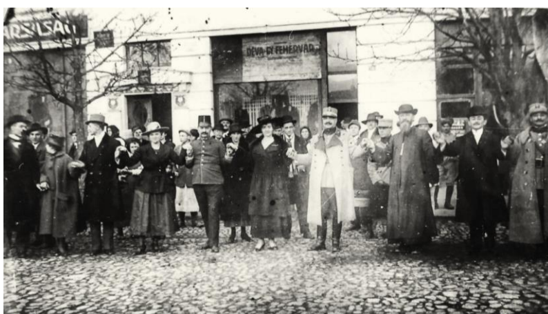
Fig. 13 - Generalul Lecca la Alba Iulia, în 27 februarie 1919 45