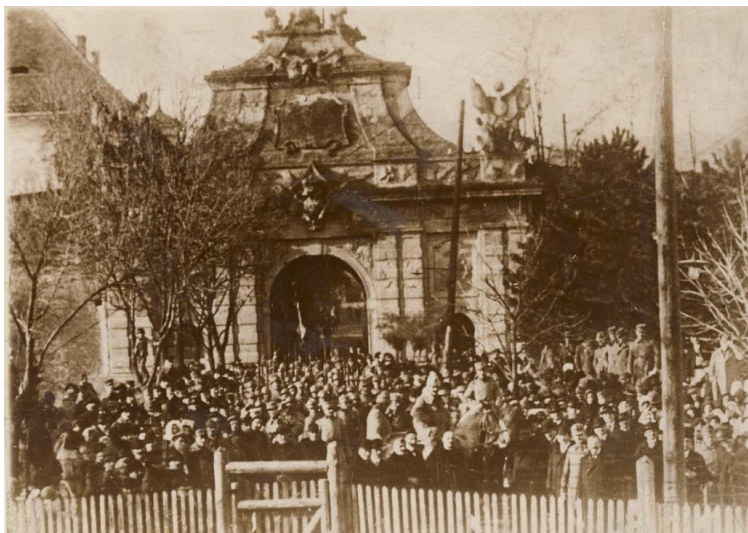
Fig. 3 - Trupele române alături de notabilitățile orașului, membrii Gărzii naționale și public, înainte de intrarea triumfală prin poarta principală a cetății 35