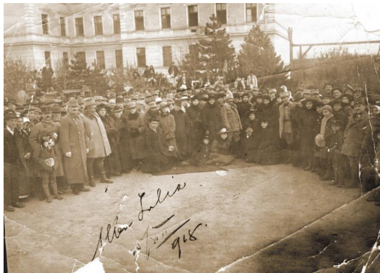
Fig. 10 - Aceiași, în poziție ușor diferită 42