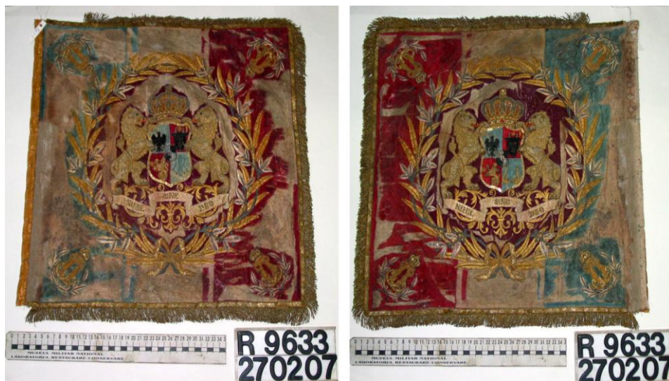
Fig. 3 - Stindardul Regimentului 11 de Călărași, model 1872. Ansamblu fața 1 și 2, înainte de restaurare