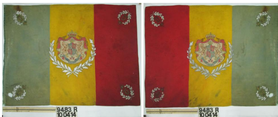
Fig. 2 - Drapelul Regimentului 44 de Infanterie, model 1872/1908. Ansamblu fața 1 și 2, după restaurare