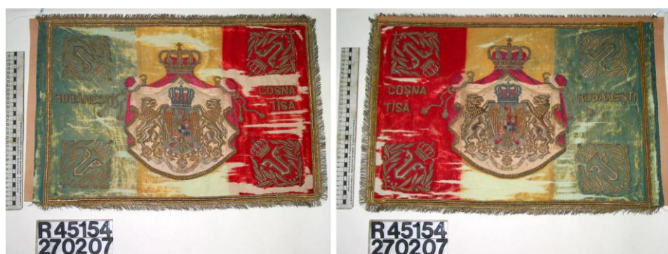
Fig. 8 - Stindardul Regimentului 4 de Roșiori „Regina Maria”, model 1922. Ansamblu fața 1 și 2, după restaurare