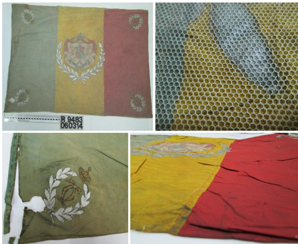
Fig. 1 - Drapelul Regimentului 44 de Infanterie, model 1872/1908. Ansamblu și detalii, înainte de restaurare