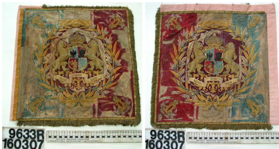
Fig. 4 - Stindardul Regimentului 11 de Călărași, model 1872. Ansamblu fața 1 și 2, după restaurare