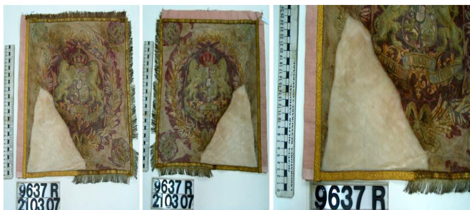
Fig. 6 - Stindardul Regimentului 4 de Roșiori, model 1872. Ansamblu fața 1-2 și detaliu, după restaurare