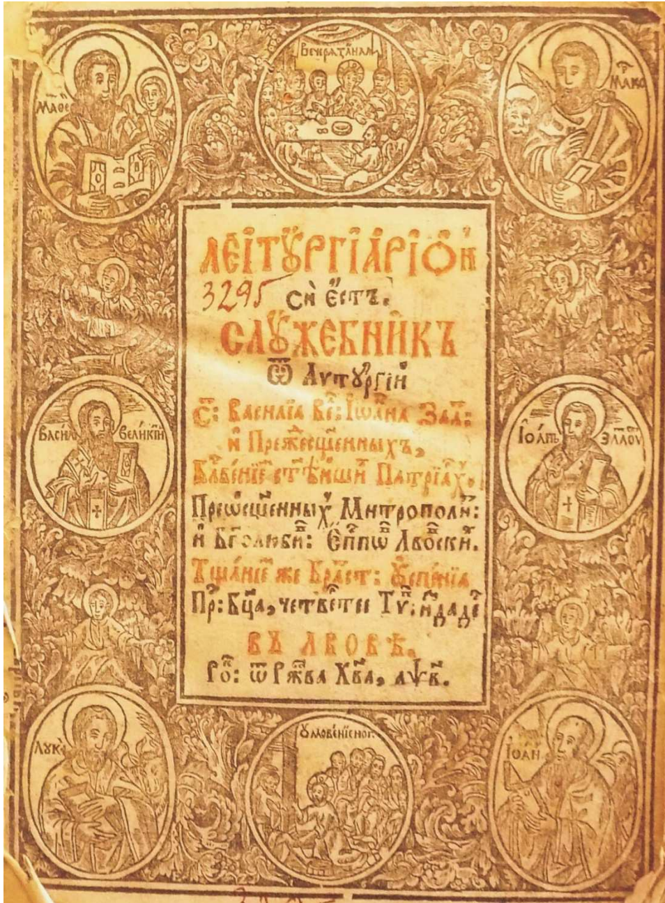
Fig. 4 - Liturghier, Lvov, 1702