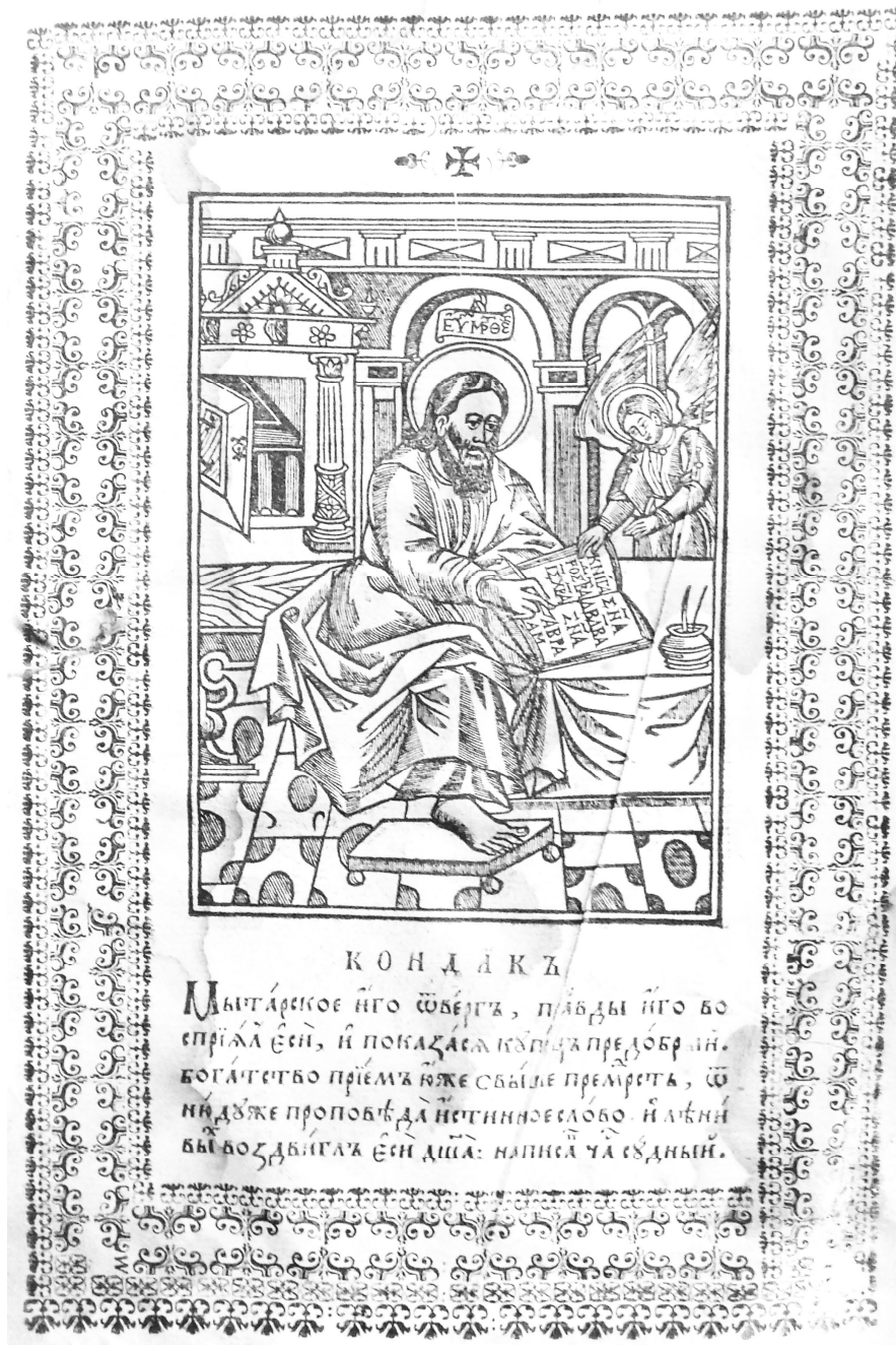
Fig. 3 - Evanghelie, Lvov, 1665