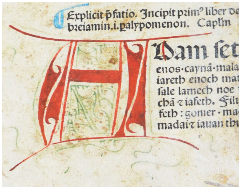
Fig. 4. – Literă pictată, Biblia , Veneția, 1478