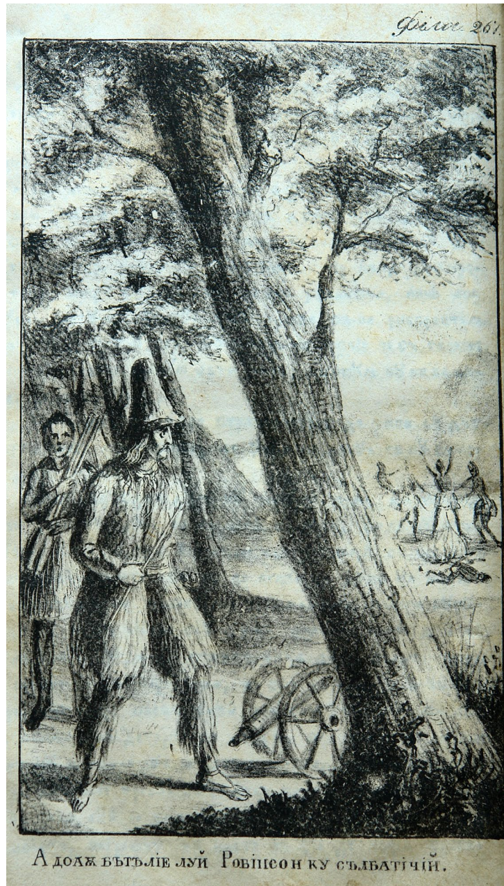
Fig. 2. - Ilustrație din Avanturile seau întâmplările lui Robinson Crusoe : „A doaua bătălie [a] lui Robinson cu sălbaticii”