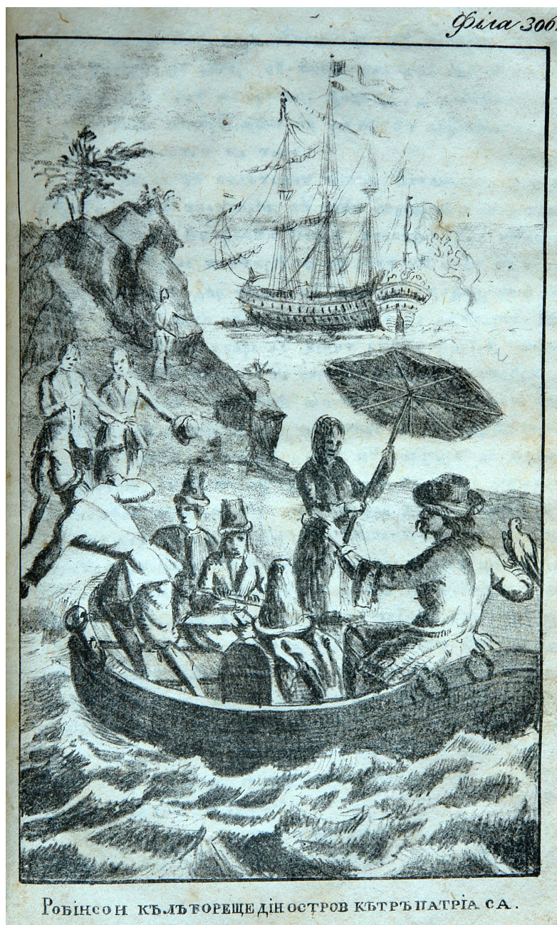
Fig. 3. - Ilustrație din Aventurile sau întâmplările lui Robinson Crusoe : „Robinson călătorește din ostrov către patria sa