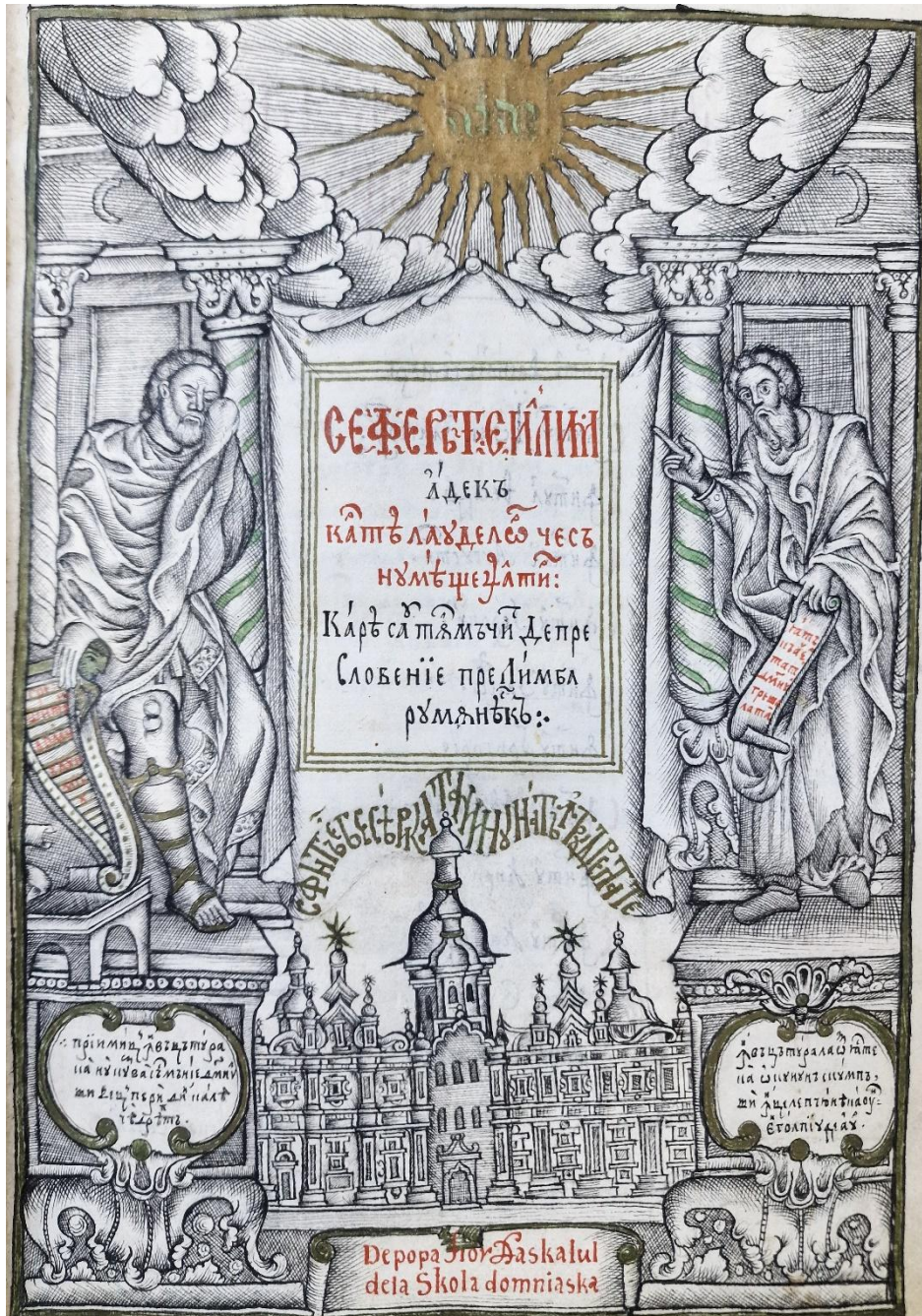
Fig. 7 – BAR, Ms. rom. 1907, foaia de titlu