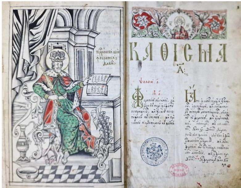
Fig. 4 – BAR, Ms. rom. 501 – Profetul David