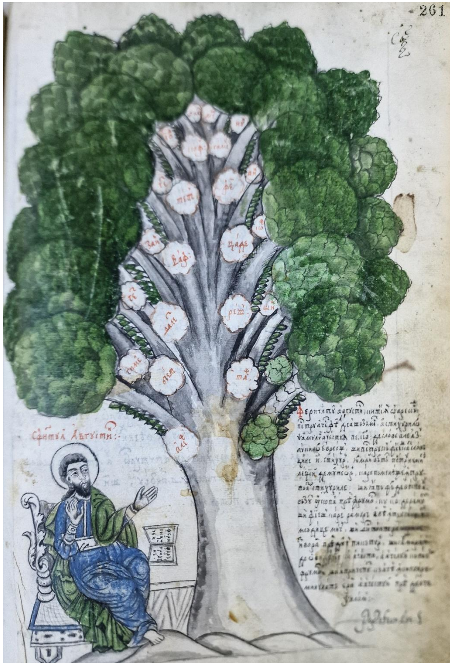
Fig. 2 – BAR, Ms. rom. 937 – Sf. Augustin