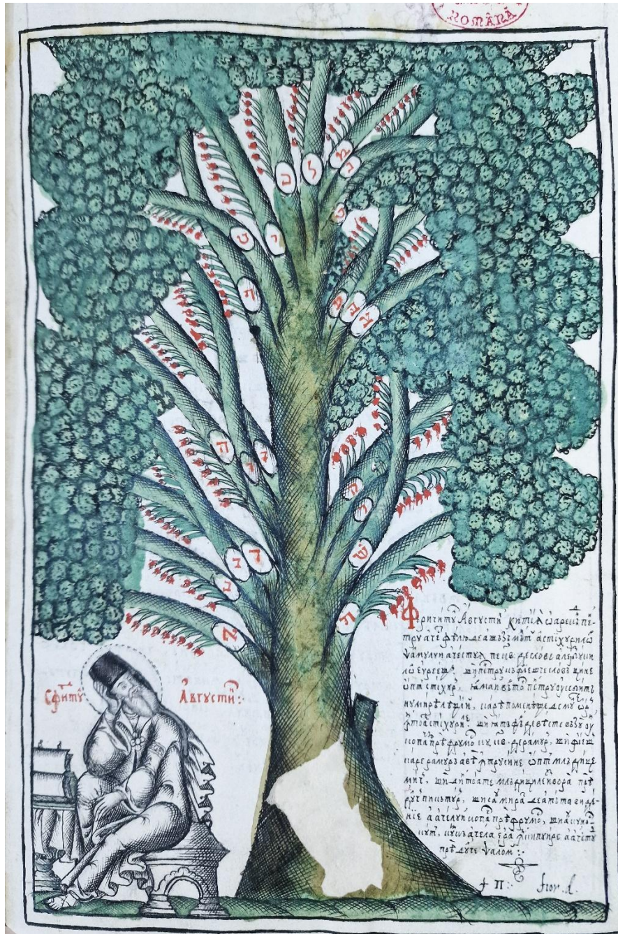
Fig. 3 – BAR, Ms. rom. 1907 – Sf. Augustin