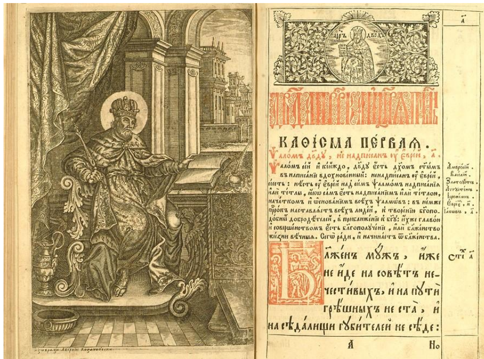
Fig. 6 – Biblioteca de Stat a Rusiei – Kiev, 1742, Profetul David