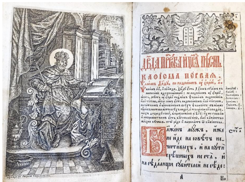
Fig. 5 – BAR, Psaltire, Kiev, 1728 – Profetul David