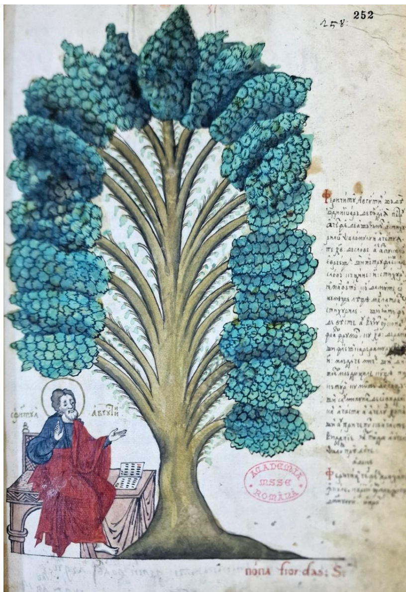
Fig. 1 – BAR, Ms. rom. 501 – Sf. Augustin