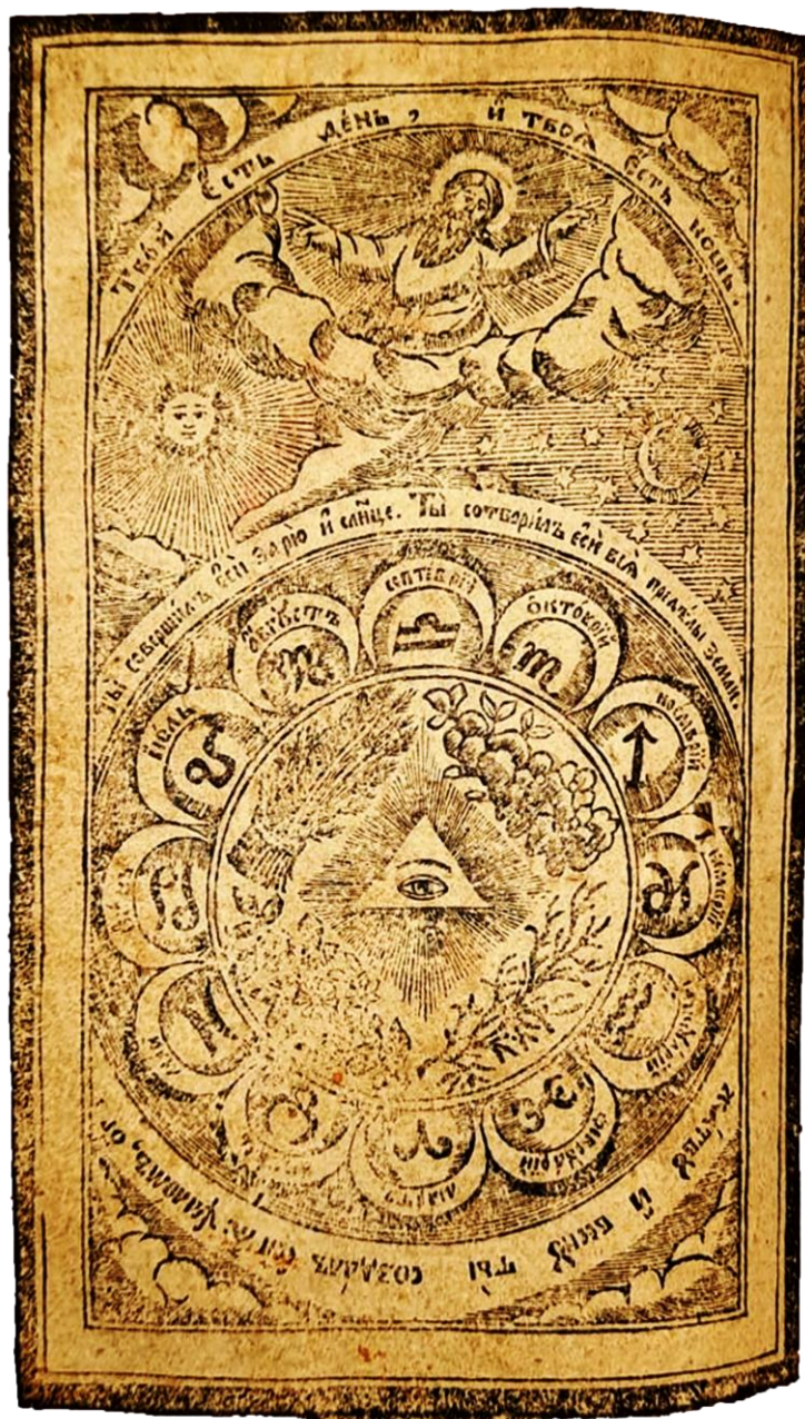
Fig. 4 – Crugul anului (Cosmosul sau Zodiacul)