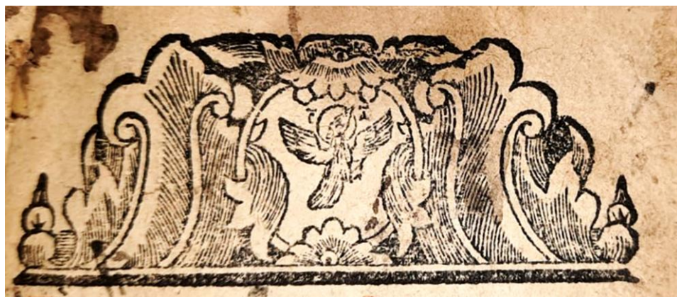
Fig. 5 – Frontispiciu cu un medalion central reprezentându-L pe Sf. Duh în chip de porumbel