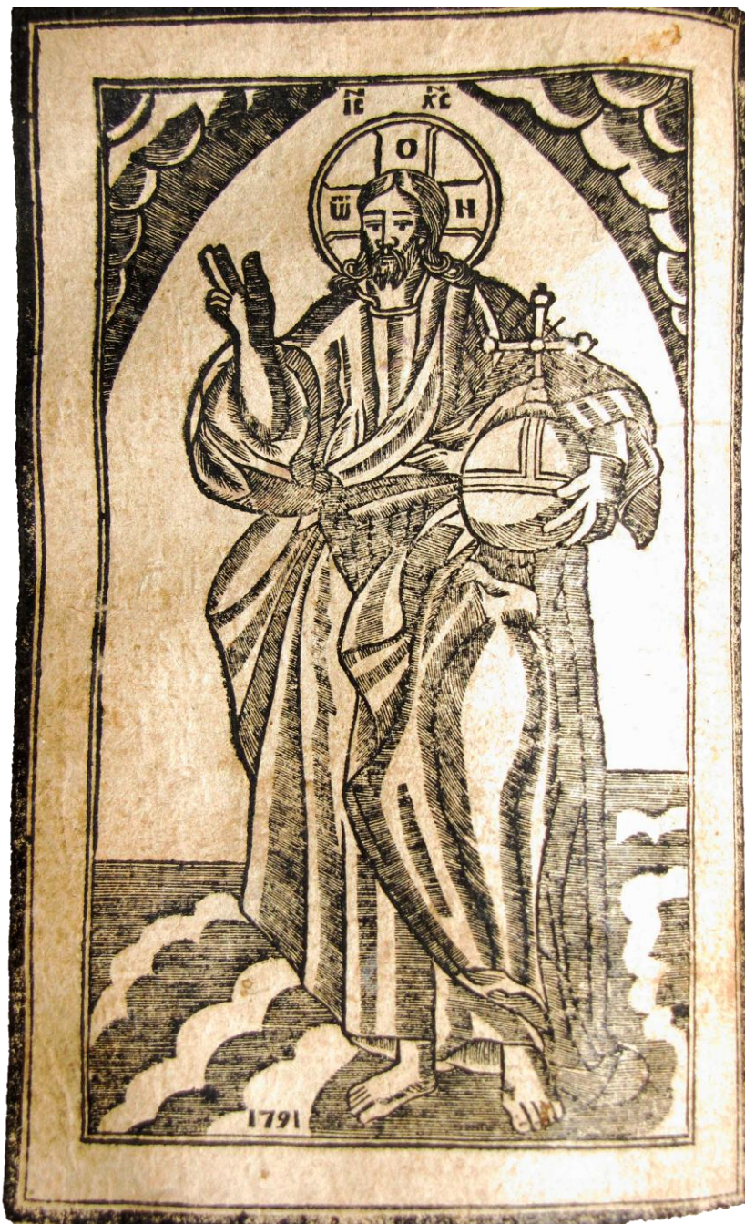
Fig. 2 – Mântuitorul Iisus Hristos