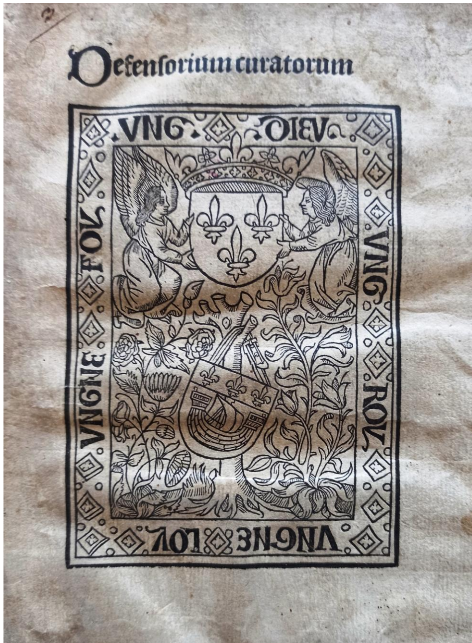
Fig. 1 – Defensorium Curatorum contra eos qui privilegiatos se dicunt. Epistola Domini Pii Papae transmissa Ludovico Christianissimo Francorum Regi, Paris, [1489-1492]