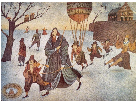
Fig. 3 - Adolf Born, Școala de patinaj al lui Komenský (Naarden, 1997) 23

După o activitate fertilă, Comenius părăsește Sárospatak în anul 1654 și se refugiază din nou la Leszno, însă și de aici a fost nevoit să fugă din fața armatelor regelui Poloniei. Mai marii Europei nu-l lasă nici acum fără ajutor. Komenský și alți exilanți cehi sunt invitați de ambasadorul Suediei la Amsterdam prin L. de Geer, fiind susținuți de el cu o sumă consistentă de bani. La Amsterdam erau deja bine cunoscute operele sale, multe dintre ele create la Sárospatak și i se oferea publicarea lor.