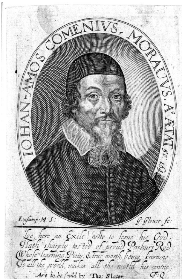
Fig. 1 - Portretul lui Jan Amos Komenský realizat de George Glover 10

A fost însărcinat de superiorii fraternității să-i conducă pe „frații boemi” în drumul lor din Cehia în Polonia. Chiar dacă Polonia a fost o țară catolică, a fost identificată drept un loc prietenos pentru protestanții cehi. Prima oprire a fost orașul polonez Leszno, unde conaștrii săi s-au bucurat de o importantă susținere din partea oficialilor orașului. Aici și-a continuat Comenius opera didactică, având și funcții în comunitatea protestantă. La Leszno a îndeplinit funcția de dascăl, dar a acordat multă atenție studiului. Didactica Magna începută la Fulnek a fost continuată și în Polonia. La Słupno a avut la dispoziție