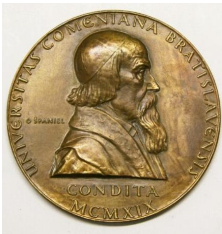
Fig. 6 – Otakar Španiel, Medalia comemorativă a Universității J. A. Komenský din Bratislava (1919) 30

J. A. Komenský a depus eforturi pentru eliberarea țării natale, a poporului ceh oprimat de Habsburgi. Activitatea sa pedagogică a lăsat urme pozitive în sistemul de învățământ din Europa pe parcursul secolelor, Komenský numărându-se printre puținele personalități, care au ajuns apreciate în timpul vieții. Teolog, pedagog, lingvist, umanist, filosof, om politic, preocupat și de științele naturii, a creat o operă ca instrument pentru instrucție, considerând cartea „un dar de la Dumnezeu pentru mintea omului”.