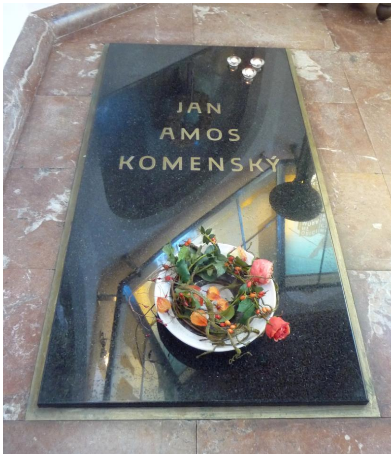
Fig. 5 - Mormântul lui J. A. Comenius din Naarden 28

Mormântul lui J. A. Komenský a fost uitat de contemporani ( Fig. 5 ). Totuși, în secolul al XIX-lea, în contextul luptei cehilor pentru independență, a fost readus în atenția conaționalilor săi și abia în anul 1871 a fost propriu-zis redescoperit. Guvernul Olandei a predat capela cu mormântul savantului guvernului cehoslovac la 28 martie 1933, fiind transformat în mausoleu. În amintirea marelui savant în Cehia și în Slovacia numele lui este purtat de societăți culturale, se comemorează în numeroase țări din Europa, universitatea