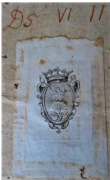
Fig. 1a - D5 VI 11, ex-libris-ul etichetă al episcopului Ignác Batthyány