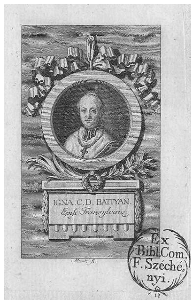
Fig. 1b - Portretul episcopului Ignác Batthyány cu ștampila Bibliotecii Széchényi, Budapesta