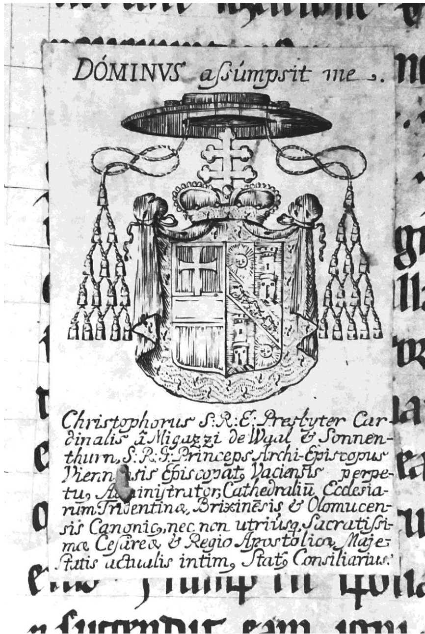
Fig. 2a - D5 V 12, ex-libris etichetă Christophorus Migazzi