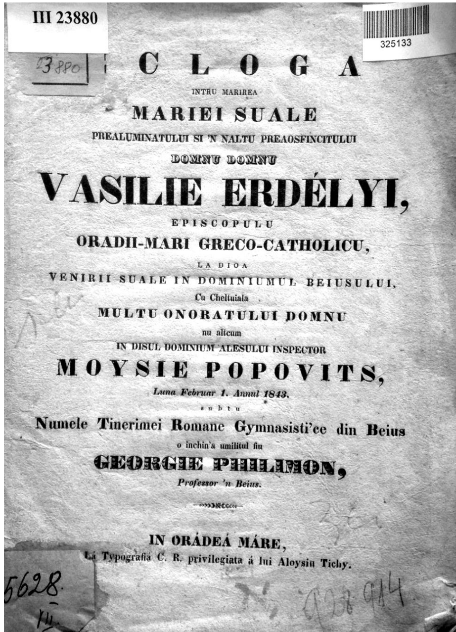
Fig. 1 - Ecloga ..., Oradea, 1843, Typografia lui Aloysiu Tichy