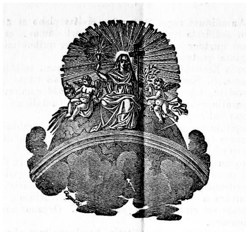
Fig. 5-6 - Detaliu din Propositio + Cathedralis Ecclesiae Magno-Varadinen. Ritus Graeco-Catholici , Roma, Ex. Typ. Rev. Cam. Apost.