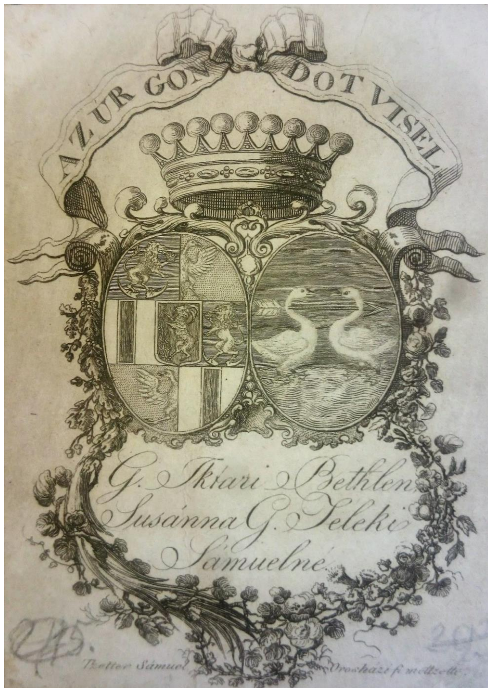
Fig. 3 – Ex-libris-ul de tip etichetă a contesei Zsuzsanna Bethlen de Iktár. Varianta b.