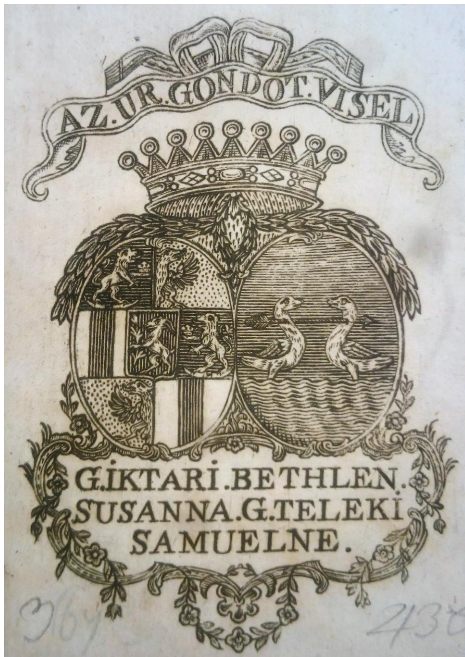
Fig. 2 - Ex libris-ul de tip etichetă al contesei Zsuzsanna Bethlen de Iktár. Varianta a.