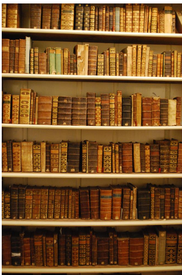
Fig. 1 - Colecția contesei Zsuzsanna Bethlen de Iktár în Sala Mare a Bibliotecii Teleki-Bolyai

Fig. 5. Manuscript catalogue of countess Zsuzsanna Bethlen de Iktár