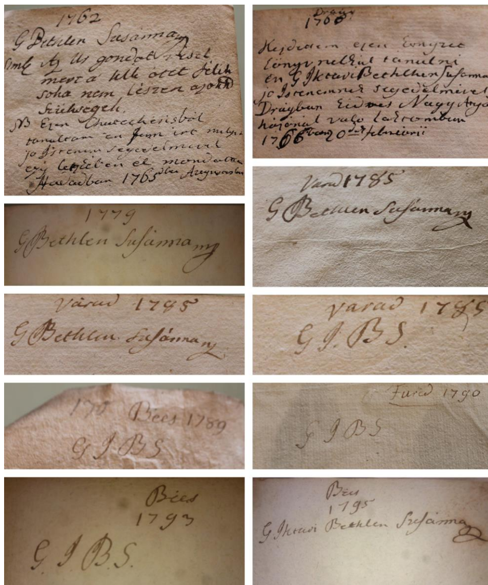
Fig. 4 - Diferite ex libris-uri de tip notă de posesor a contesei Zsuzsanna Bethlen de Iktár