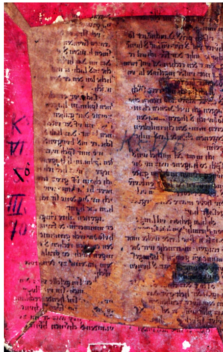
Fig. 3 – Interiorul copertii manuscrisului